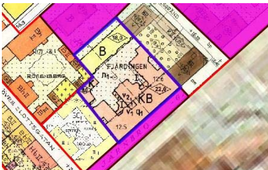
Utsnitt ur gällande detaljplan. Planområdet är markerat med blå linje.