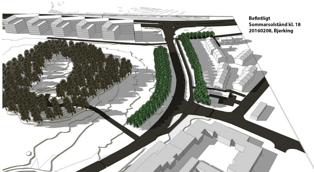
Befintligt Sommarsolstånd kl. 18 20160208

Nuvarande förhållanden vegetationen medför skuggpåverkan på Flogstavägen och västligaste tomterna vid Oslogatan