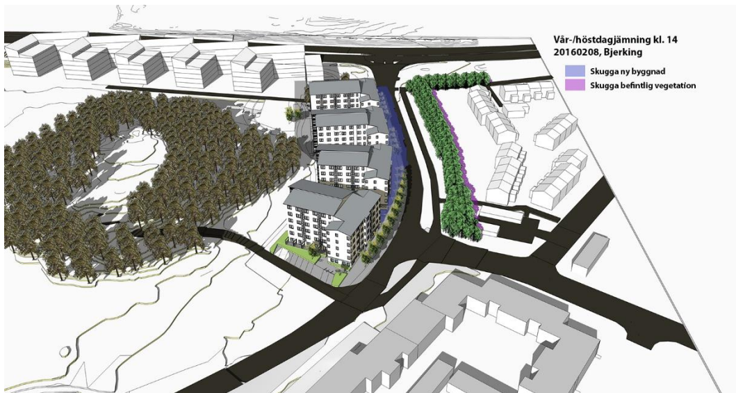
En mindre del av gaturummet i Flogstavägen skuggas av den planerade bebyggelsen.