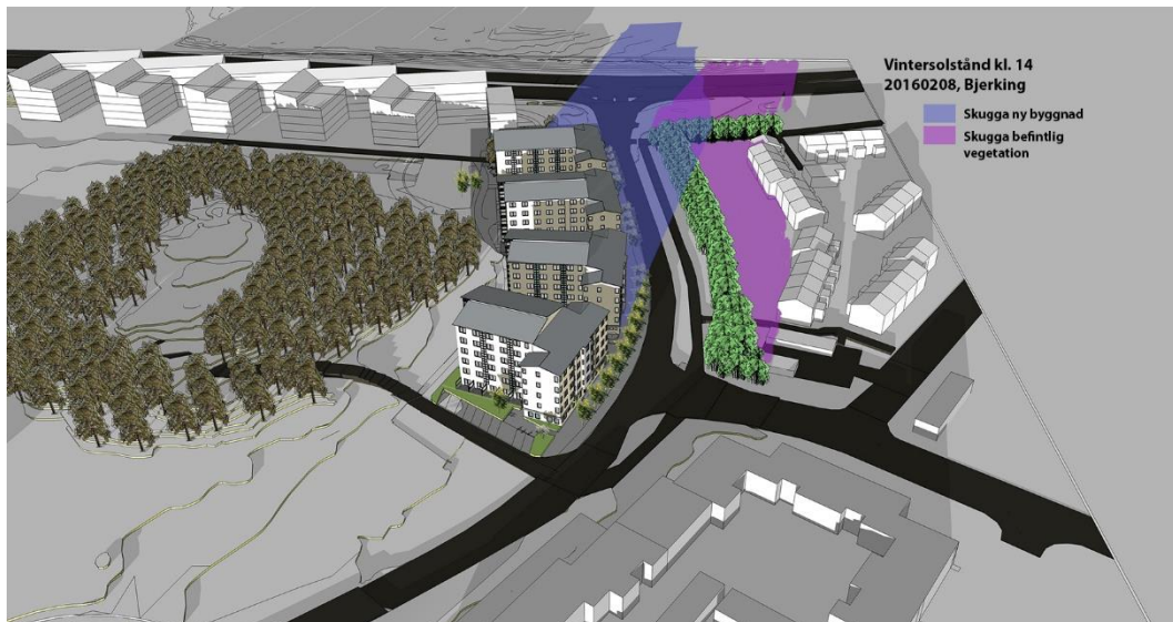
Den föreslagna bebyggelsens skuggpåverkan berör i första hand Flogstavägen. I nuläget har tomterna vid Oslogatan en betydande skuggpåverkan från befintliga vegetationsridåer.