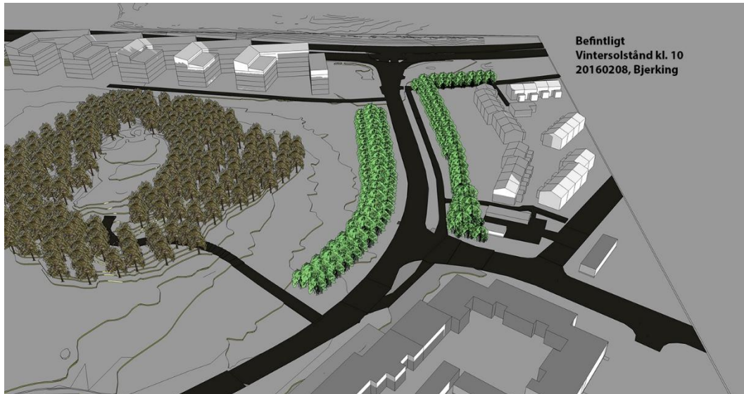
Nuvarande förhållanden - vegetationen och befintliga byggnader skuggar tomter och delar av parken / odlingslotterna