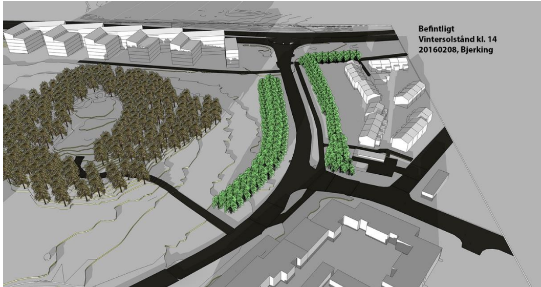
Nuvarande förhållanden vegetationen och befintliga byggnader medför skuggpåverkan på Flogstavägen och tomterna vid Oslogatan