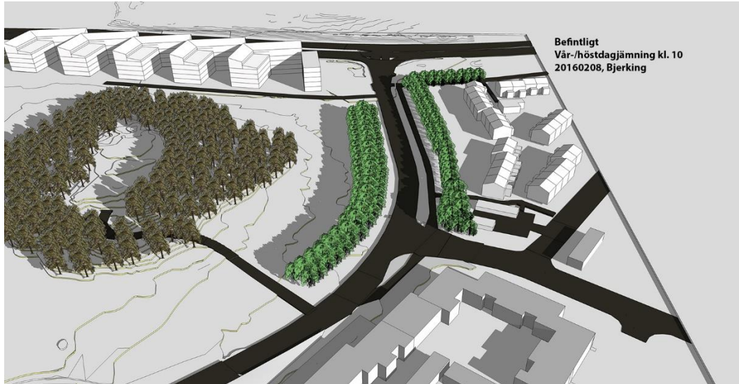
Nuvarande förhållanden - vegetationen skuggar delar av parken / odlingslotterna