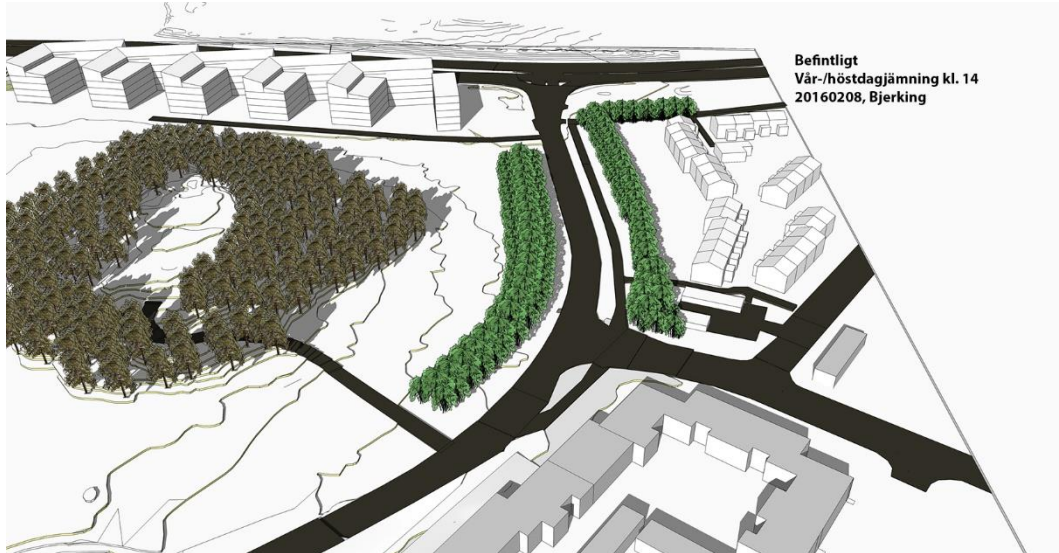
Nuvarande förhållanden vegetationen medför liten skuggpåverkan