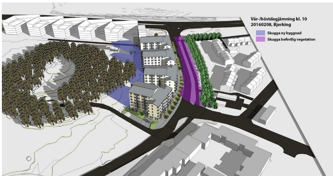
Den nya bebyggelsen skuggar parken och en mindre del av en av gårdarna i kvarteret Majklockan norr om området.