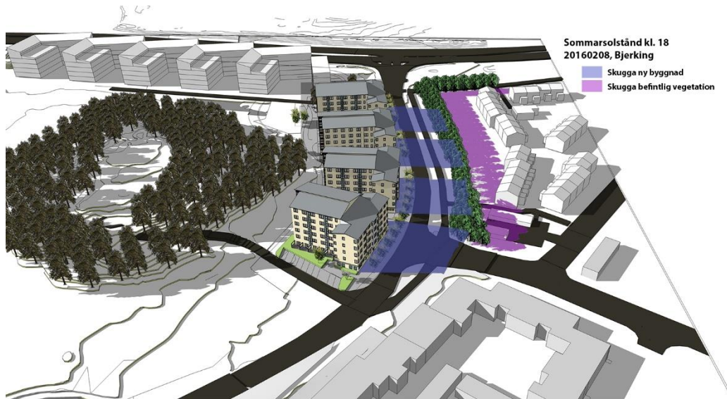
Sommarsolstånd kl. 18 20160208, Bjerking ■ Skugga ny byggnad ■ Skugga befintlig vegetation

Nuvarande förhållanden vegetationen medför skuggpåverkan på Flogstavägen och västligaste tomterna vid Oslogatan