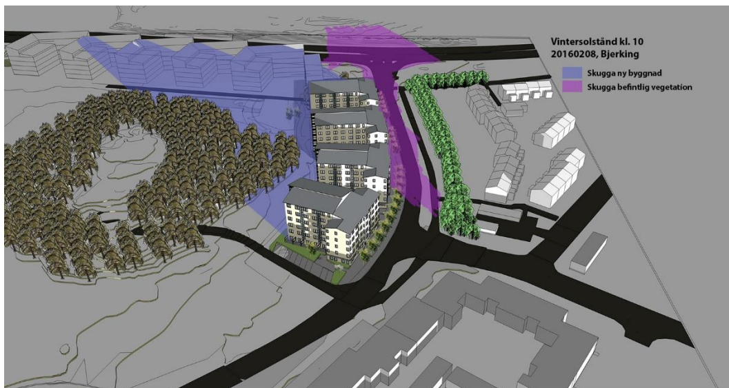
Den nya bebyggelsen medför en ökad skuggpåverkan på parken och en del av byggnaderna samt gårdarna i kvarteret Majklockan norr om området.