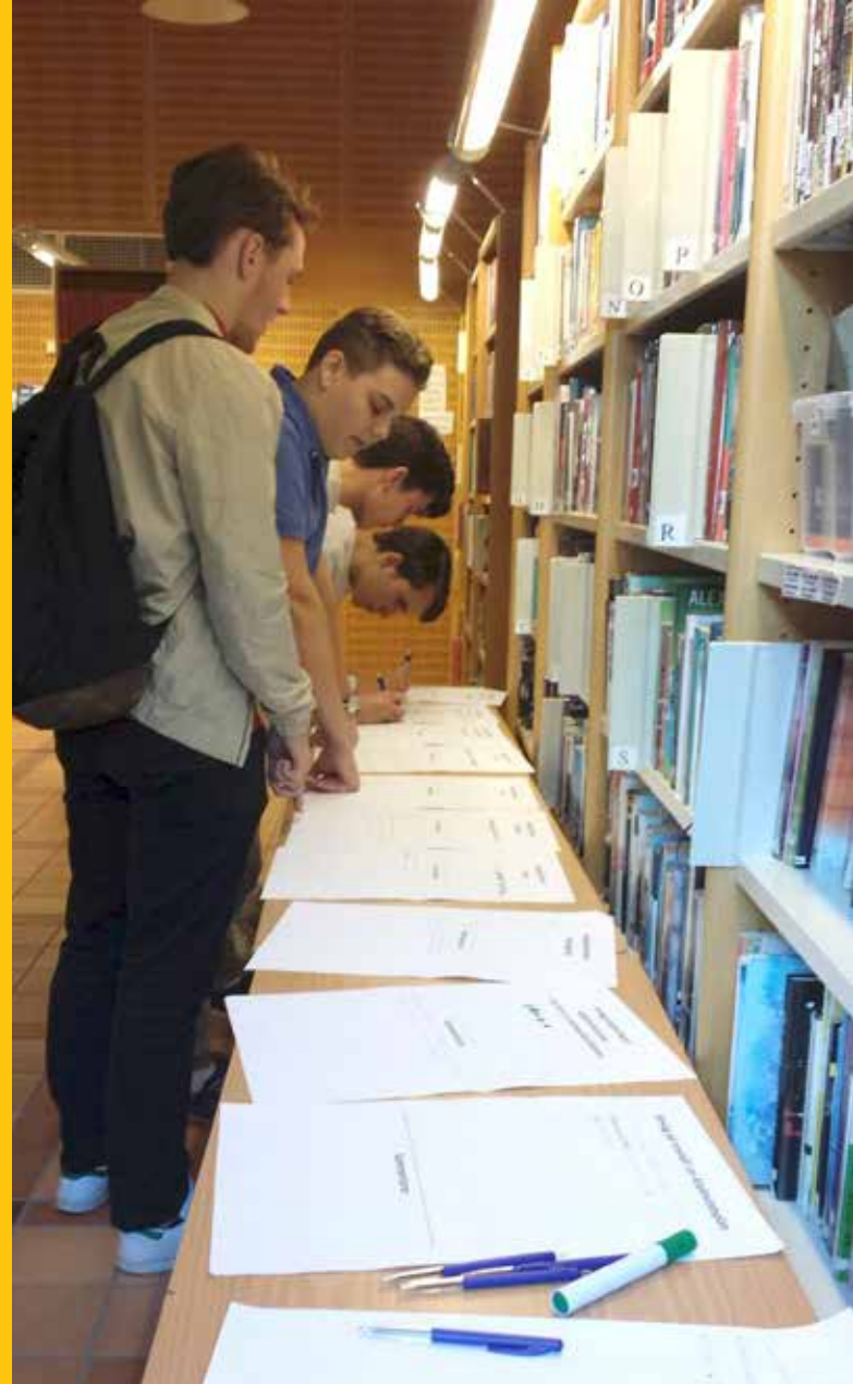
Bild 10: Inlämning av synpunkter gällande idrott- och fritidsanläggningar.