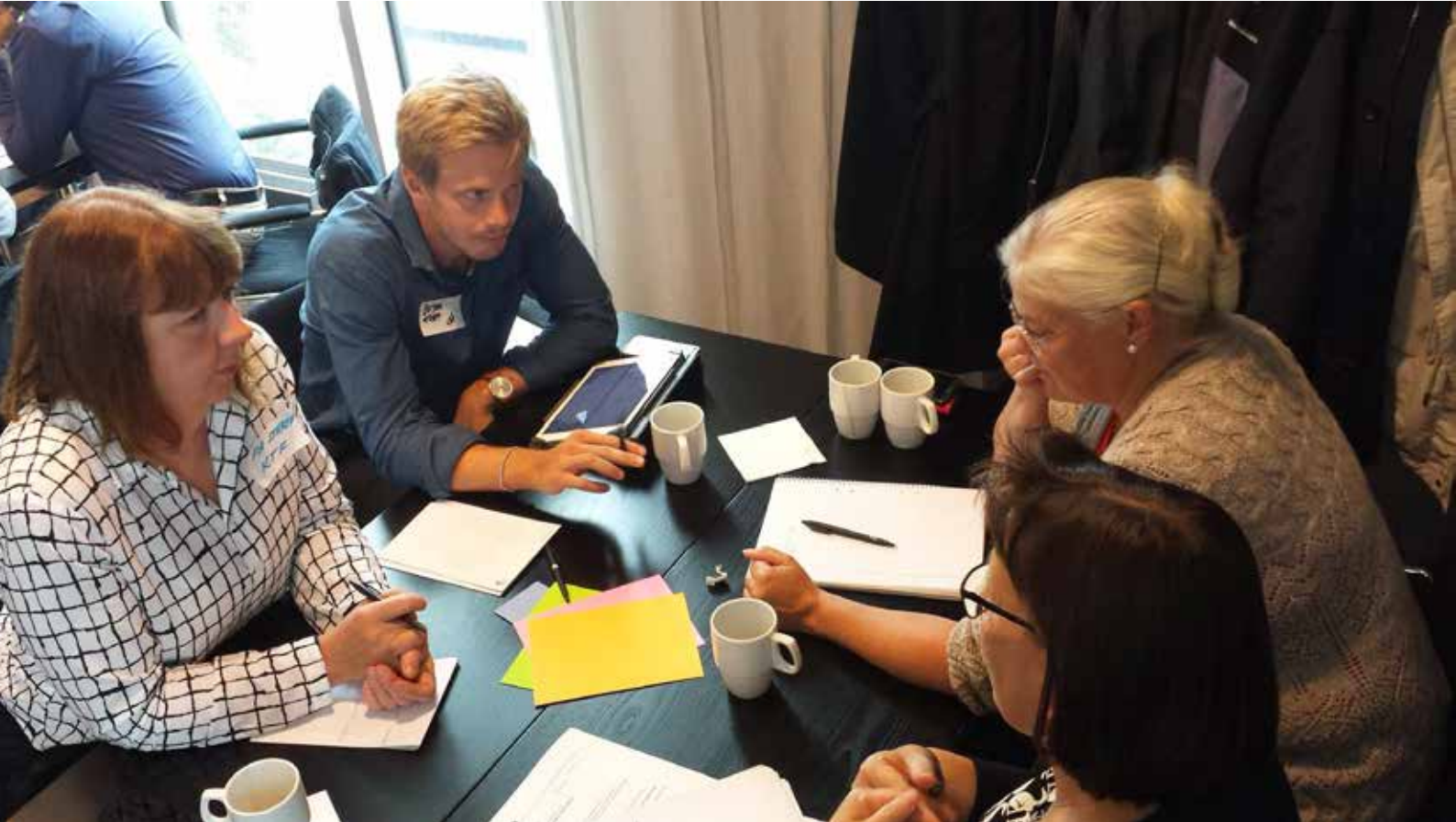
Bild 6: Gruppdiskussion om medborgarnas synpunkter från kvällsmöten.