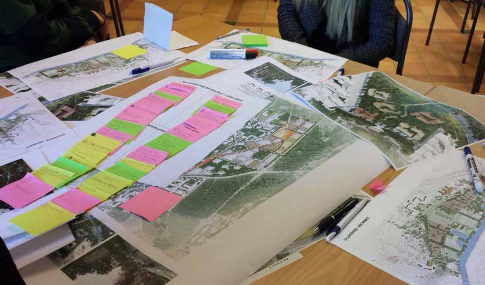
Bild 12: Synpunkter gällande namngivning till platser och parker i Ulleråker.