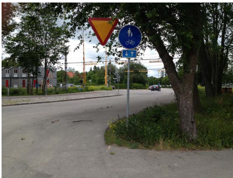
Läge för ny föreslagen planskild korsning vid Ringgatan. (Tengbom)

Det finns planer på en planskild korsning mellan järnvägen och Ringgatan. För att kunna skapa en planskild korsning krävs vissa anpassningar i gatunätet. I samband med planarbetet för kv. Seminariet norr om järnvägen har trafiktekniska studier gjorts för sänkningen av Ringgatan, vilka är relevanta även söder om järnvägen. Götgatan behöver stängas för trafik vid en ombyggnad, eftersom anslutningen till Ringgatan då skärs av. En vändplan som är tillräckligt stor för underhållsfordon behöver därför skapas, och utanför den behövs en ca 50 meter lång ramp för gång- och cykeltrafik. Dessa anpassningar kan ske på befintlig gatumark och påverkas inte av planförslaget.