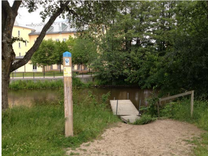
Brygga som utgör dagens vattenkontakt längs aktuell område. (Tengbom)