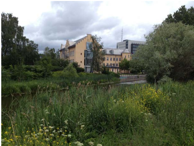
Å-rummet och kv. Heimdal sett från aktuellt planområde. (Tengbom)

Aktuellt planområde är idag utformat så att inga direkta kopplingar finns från Götgatan till å-rummet. Miljön kring skolan är idag behov av upprustning. Engång- och cykelväg går i det allmänna parkstråket längs Fyrisån och följer sedan järnvägen norrut mot Ringgatan. Parkstråket längs Fyrisån i detta avsnitt har naturmarkskaraktär. En provisorisk passage under järnvägen, längs med ån, har anordnats för att öka tillgängligheten mellan aktuellt planområde och ny bebyggelse i det angränsande kvarteret Fyrisvallen.