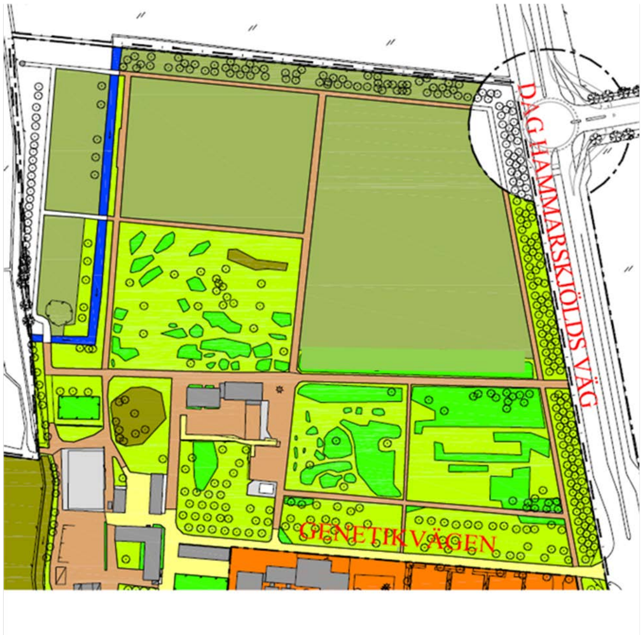
Figur 1. Norra delen av genetiska trädgården 2013