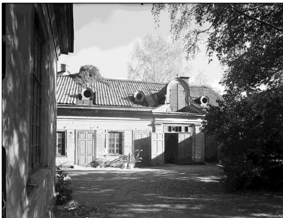
Gården bakom de Geerska huset år 1950. Här fanns allt nödvändigt som stall, vagnslider etc. då familjen de Geer besökte Uppsala under 1700- och 1800-talen.