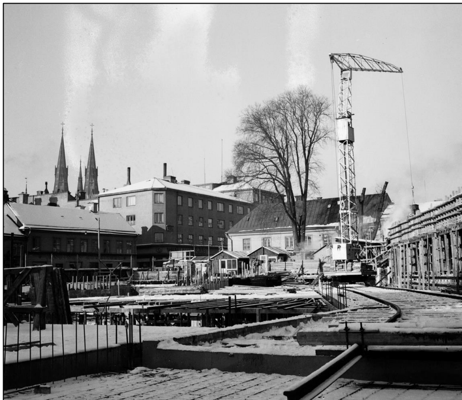
Varuhuset Forum under byggnation i mars 1952. På bilden syns det bevarade vårdträdet till vänster om byggekranen.