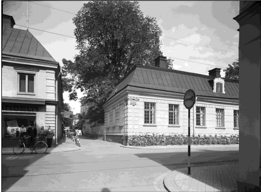
Smedsgränd innan rivningen av de Geerska huset 1950. Strax bakom gatuhuset syns det stora vårdträd man avsåg att bevara genom att skapa Forumtorget.

Vid rivningen av de Geerska huset valde man att bevara ett stort vårdträd intill tomtragröns längs Smedsgränd. Konsekvensen av detta blev att man på så vis skapade ett torg i hörnet mot Kungsängsgatan; Forumtorget. Trots höga ambitioner kom dock inte trädet att stå särskilt länge utan togs bort efter några år.