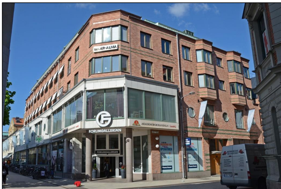
Forumgallerians huvudentré i korsningen Dragarbrunnsgatan/Bredgränd. Här syns hur det gamla Forumhusets marmorfasad (till vänster) fortsätter på den nya byggnaden och slutar som ett burspråk runt hörnet. Därefter tar ett helt tegelklätt parti över vilket förmedlar kopplingen till Upsala Sprits gamla murade byggnad (utanför till höger i bild). Huset bildar således en länk mellan de äldre husen, utan att göra avkall på sitt moderna formspråk.

Exempelvis tog man upp första våningens marmorfasad på gamla Forum längs Bredgränd medan fasaden mot Dragarbrunnsgatan endast fick en stensockel i likhet med före detta Upsala Sprits byggnad. Ytterligare en tydlig koppling gjordes med banden av grönglaserat tegel vilka hade sin motsvarighet i Upsala Sprits entréfasad. För att ge samtliga byggnader samma karaktär murades också fasaderna av tegel på det nya huset. Stilen var dock tydligt modern och därmed blev den nya gallerian den tredje årsringen i kvarteret.