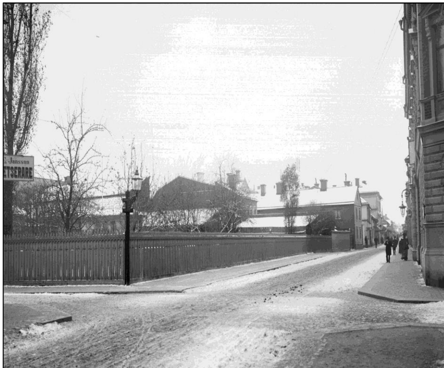
Efter att Dragarbrunnsgatan förlängts på 1870-talet stod tomten i hörnet Dragarbrunnsgatan/Bredgränd obebyggd ända fram till 1940-talet. Notera att Upsala Sprit AB inte ännu uppfört sin byggnad i borte änden av kvarteret. Foto omkring år 1902 av Alfred Dahlberg. Ur Upplandsmuseets arkiv.