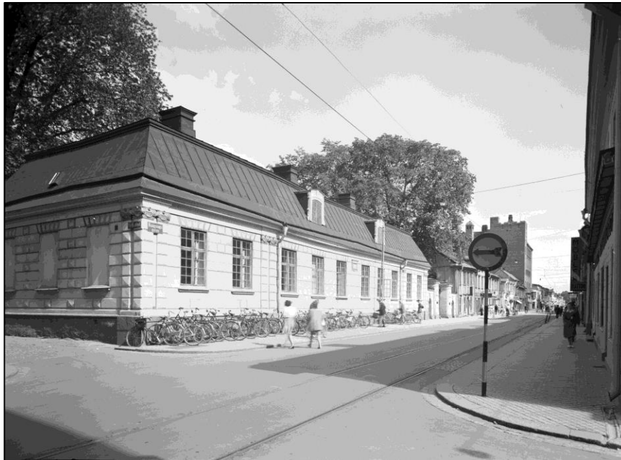
De Geerska huset i korsningen Kungsängsgatan/Smedsgränd strax innan det revs år 1950.

Åldern på kvarterets bebyggelse idag sträcker sig från sekelskiftet 1900 till omkring 1990. Innan rivningarna som föregick bygget av Forum såg dock kvarteret helt annorlunda ut. Då fanns på samma tomter två gårdar uppbyggda under 1700- respektive det tidiga 1800-talet varav den ena som Leufstafamiljen de Geers stadsgård. Rivningen av dessa framhölls av Riksantikvarien som ett kulturmord men staden ansåg att det var en nödvändig del av saneringen av Uppsala för att möjliggöra handelns utveckling i de centrala delarna.