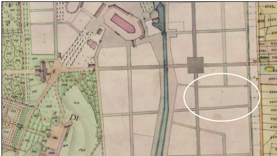
Karta över Uppsala 1854. Här syns att kv. Pantern fortfarande var en del av kv. Oxen. Inte förrän på 1870-talet förlängdes Dragarbrunnsgatan söderut så att kvarteret delades.

Dagens kvarteret Pantern är en förhållandevis sen konstruktion för att vara en del av Uppsalas centrala delar. När en ny rutnätsplan upprättades för staden på 1600-talet utgjorde detta kvarter istället den södra halvan av kvarteret Oxen. Inte förrän på 1870-talet förlängdes Dragarbrunnsgatan till det som då var stadens utkant; Strandbodgatan. Med detta skapades två kvarter, men till en början benämndes båda som Oxen. Först en bit in på 1880-talet fick Pantern sitt nuvarande namn.