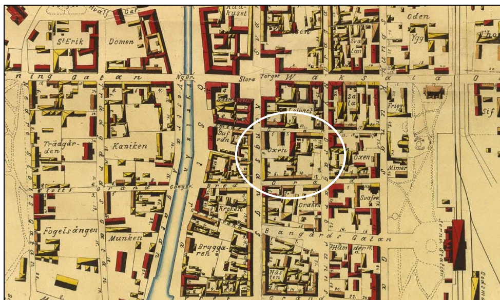
Karta över Uppsala 1882. Här syns att kv. Oxen delats men även kv. Panterns öppna karaktär åt Dragarbrunnsgatan. Denna sida förblev obebyggt in på 1940-talet.

Med 1880-talets utökade stadsplan befästes kvarterets storlek men det kom att dröja innan det bebyggdes i sådan omfattning att det upplevdes som ett stadskvarter. Åt Dragarbrunnsgatan behöll det ett långt obebyggt parti ända in på 1940-talet. Det var först då som det blev helt kringbyggt.