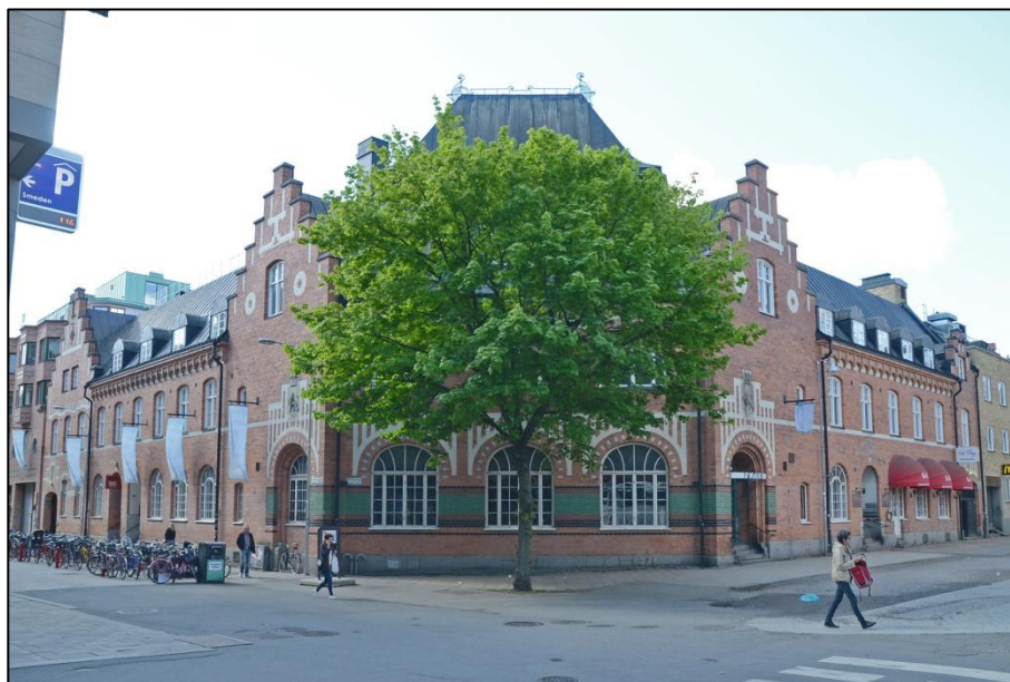
Spritpalatset – Uppsala Sprit AB – har behållit sin utvändiga karaktär i det närmaste helt från 1904. Takkuporna tillkom 15 år senare men förändrade inte det arkitektoniska uttrycket. Det avskurna hörnet var okonventionellt i en så strikt rutnätsplan som Uppsalas.