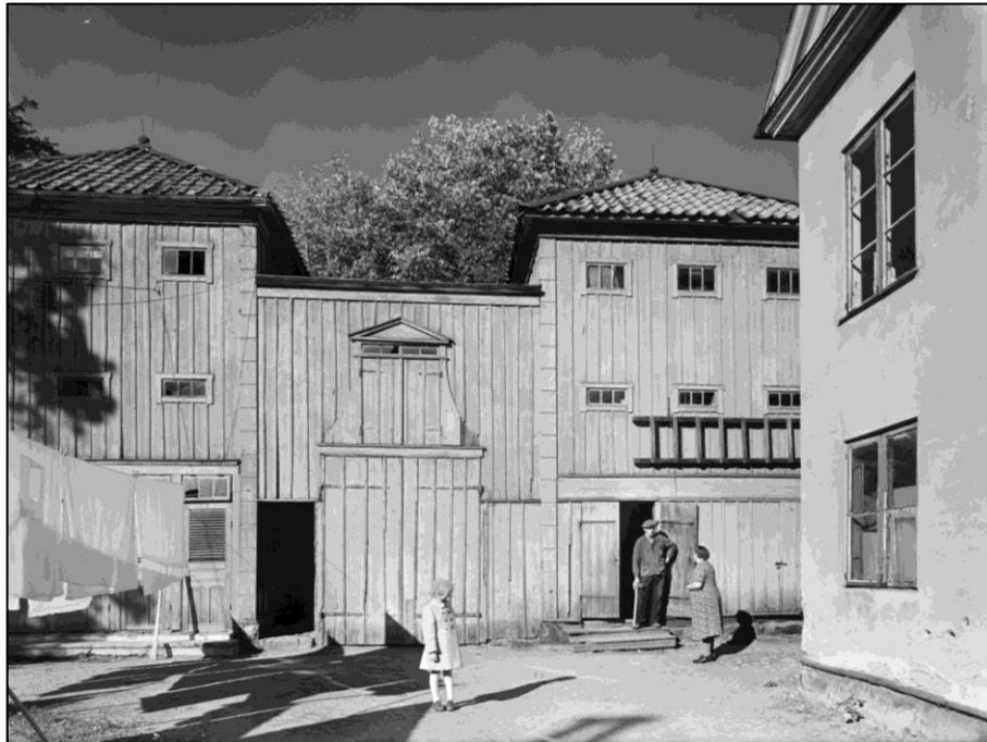
På gården fanns en ståtlig uthuslänga med stall, vagnslider, förråd och dass m.m. Notera att hörnen har en panel som imiterar hörnedjor av huggen sten.