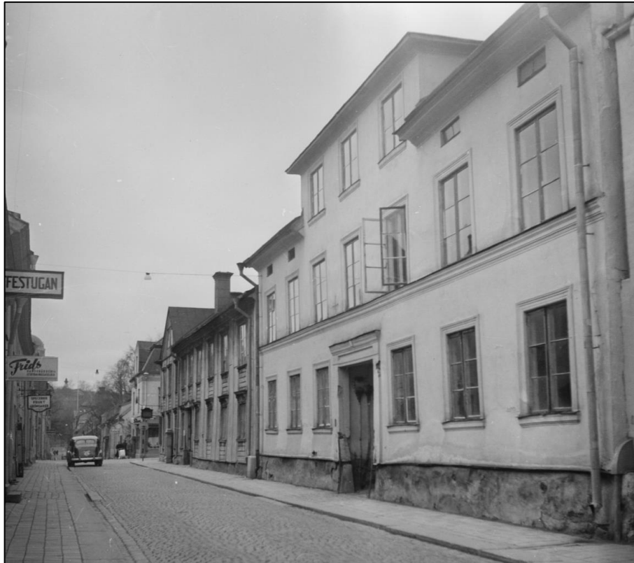
Längs Bredgränd, i kvarterets mitt, låg detta reverterade två och en halv våningshus i vilket bl.a. "Antik-Olle" hade sin butik. Huset revs då Forum skulle byggas i början av 1950-talet. Bilden är något beskuren i nederkant. Foto Ivar Laurén år 1950 i Upplandsmuseets arkiv.