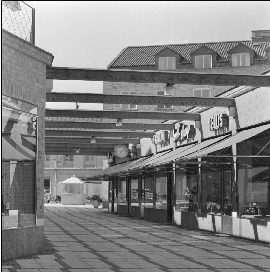
Affärsgatan Diagonalen vid mitten av 1950-talet.

Initiativet till varuhuset Forum togs av Kooperativa förbundet, KF. De köpte marken i halva kvarteret och ritade samt projekterade själva samtliga nya byggnader. Med varuhuset skapades också den öppna affärsgatan Diagonalen som skar tvärs igenom kvarteret från Forumtorget till Bredgränd. Idén hade en förebild i kv. S:t Per där delar av den medeltida kvartersstrukturen alltjämt fanns kvar. Längs Diagonalen låg butiker i en våning men med tiden kom den att byggas över och byggas om. Innan den stora ombyggnaden i slutet av 1980-talet fanns här bland annat en livsmedelsbutik.