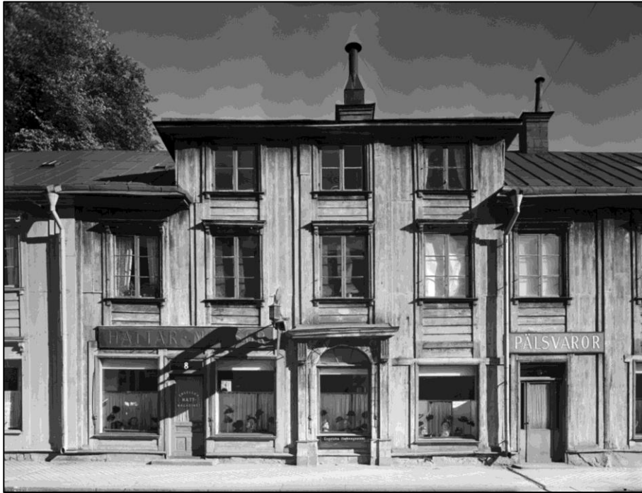
Bilden visar den gård som låg i hörnet Kungsängsgatan/Bredgränd med denna fasad mot Kungsängsgatan. Fotot är taget strax innan rivningen 1950.