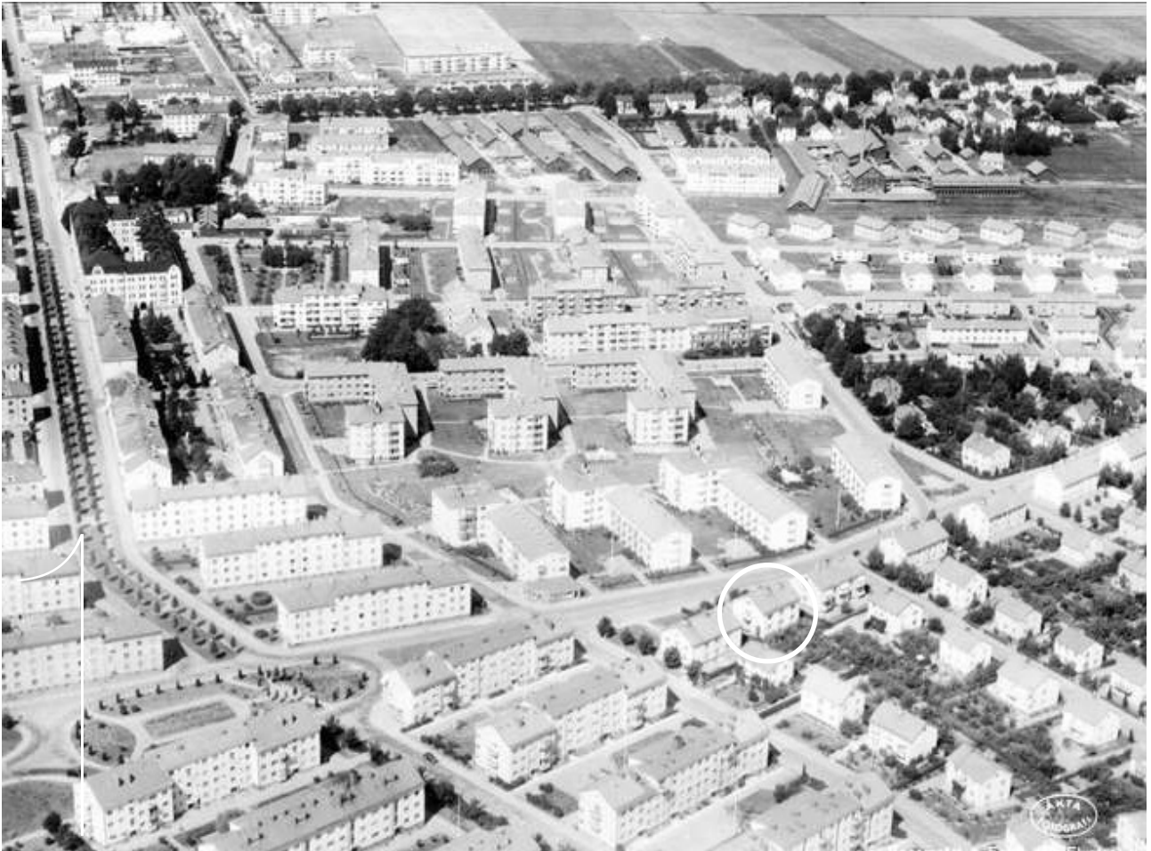
1. Flygbild över Fålhagen från 1947. Den aktuella byggnaden är markerad med cirkel.