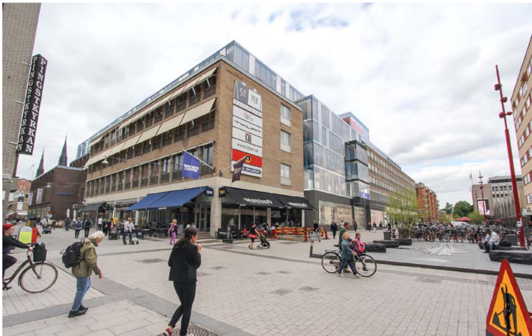
Volymillustration som visar den föreslagna påbyggnaden sett från korsningen Dragarbrunnsgatan/S:t Persgatan. Illustration: Sweco architects