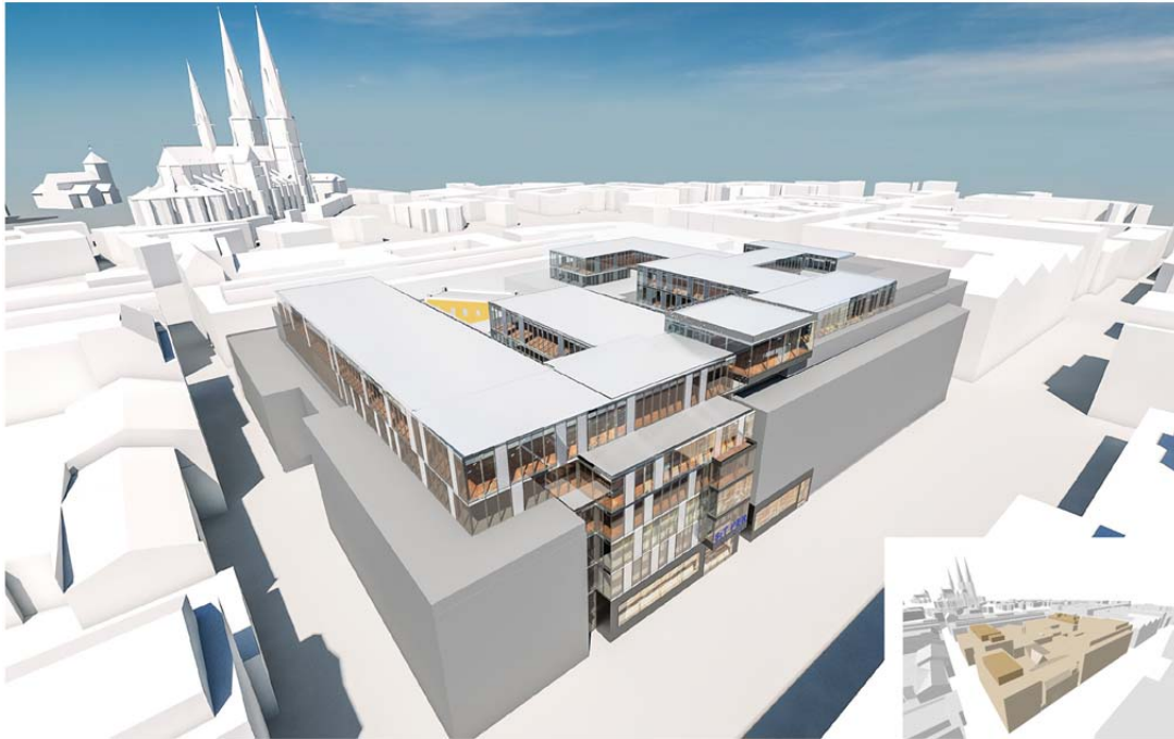
Volymstudie som visar föreslagen påbyggnad sedd ovanifrån. S:t Persgatan till vänster och Dragarbrunnsgatan till höger. Illustration: Sweco architects

I närområdet finns ingen risk- eller störningsskapande verksamhet som på ett betydande sätt kan påverka föreslagen användning, kontor, hotell och handel, negativt.