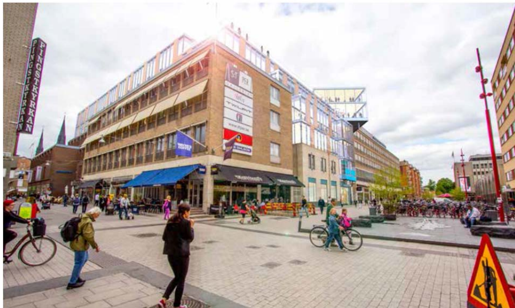
Vy Dragarbrunnsgatan med skybar, förslagsskiss Sweco 2013-10-09