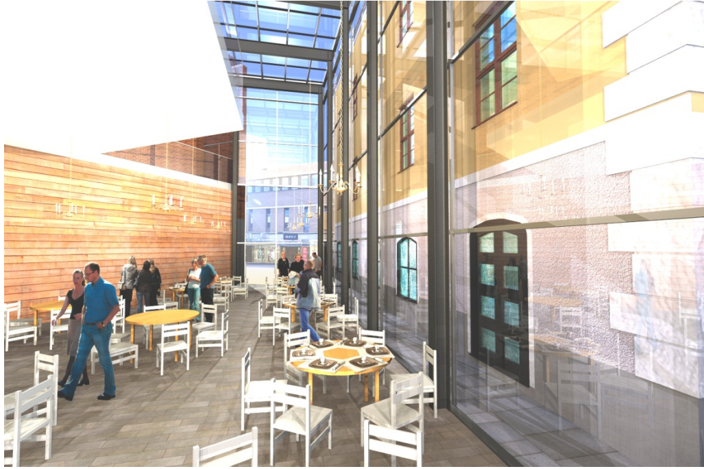
Möte Celsiushusets södra fasad, interiör, förslagsskiss Sweco 2013-12-20