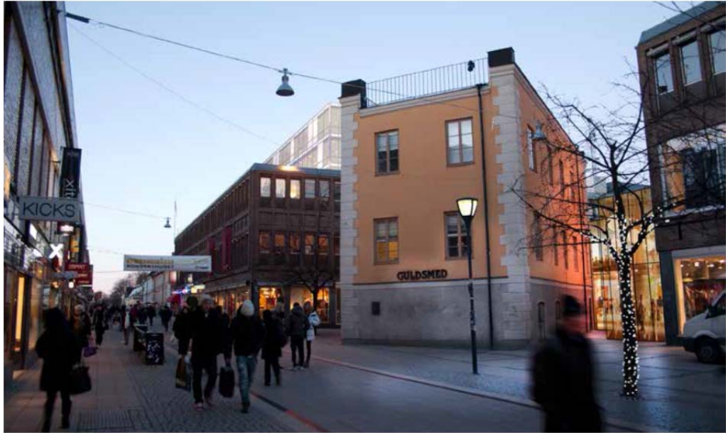
Vy Svartbäcksgatan, förslagsskiss Sweco 2013-10-09