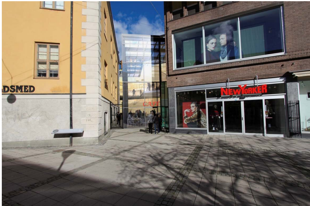
Möte Celsiushusets södra fasad, exteriör, förslagsskiss Sweco 2013-12-20