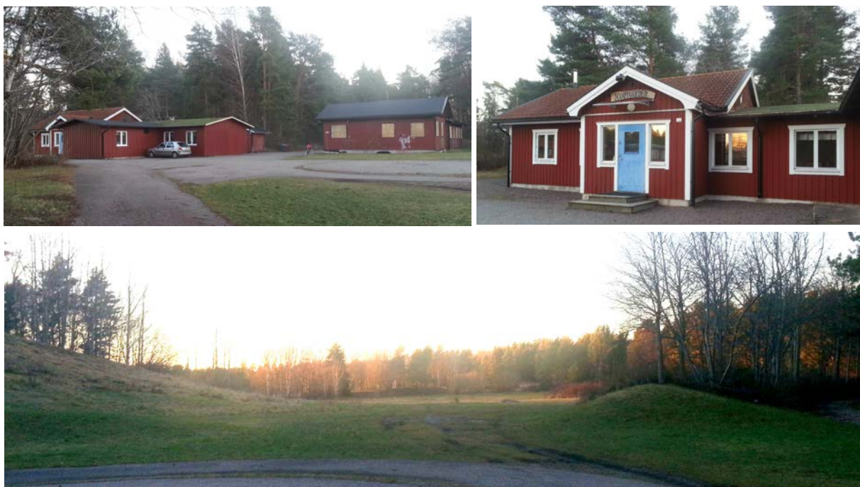
De övre två bilderna visar bebyggelsen som ingår i det tänkta planområdet. På nedre bilden illustreras platsens funktion som entré till naturreservatet.

Något som saknas på platsen är angöringsväg med bil till verksamheten. Bilangöring sker idag via en gång- och cykelväg som är planlagd som parkmark. Användningen som angöring är dock inte förenlig med ändamålet parkmark.