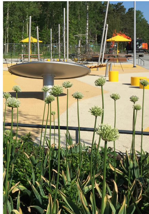
Bilder från nya Solvallsparken.