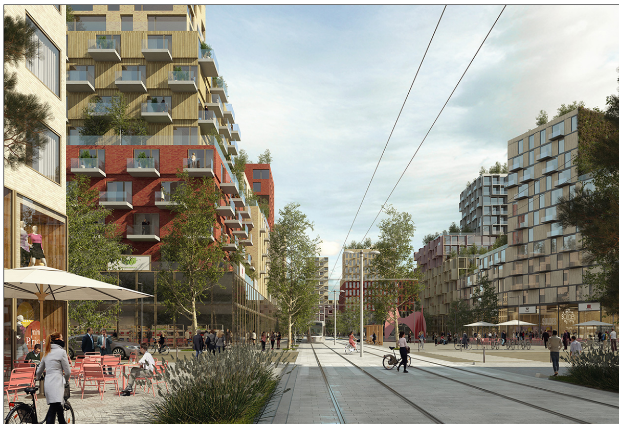
Illustration: EGA Erik Giudice Architects