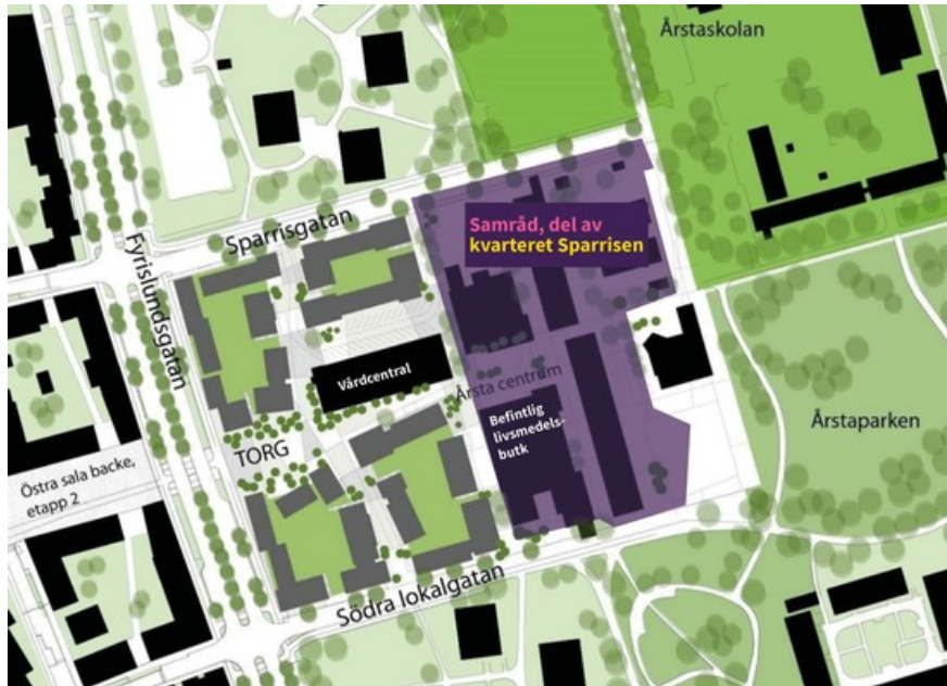
Bild: Området för det pågående planarbetet med del av kvarteret Sparrisen. Bilden visar även placeringen för nya Årsta torg i väster och med möjlig ny bebyggelse runt omkring, som är en redan antagen detaljplan.