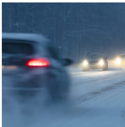
Följ utvecklingen av Trafikplats Fullerö

Om du är nyfiken på vad som händer i projektet med Trafikplats Fullerö kan du följa arbetet på Trafikverkets hemsida