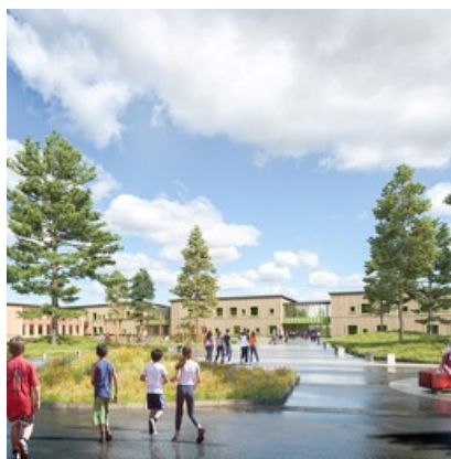
Illustration av skolgård, Metod arkitekter

Vi har nu sammanställt synpunkter från granskningen av detaljplanen. Tack till er som engagerat er och lämnat yttranden. Vi arbetar med att sammanställa ett förslag till detaljplan som förväntas kunna antas i kommunfullmäktige under april 2024.