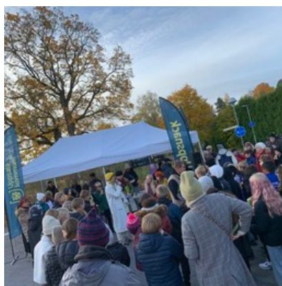
Konstinvi gning och Uppsnack om

I samband med Storvretadagen genomförde vi dialoger kring framtidens Storvreta under rubriken "Uppsnack". Vi fick in många bra synpunkter, men inte så många från barn och unga. Vi passade därför på att fråga de elever som var med vid konstinvi gningen om vad de tycker om Storvreta/Fullerö. De fick markera platser på kartor och beskriva om platsen är bra, om den behöver utvecklas, eller om platsen känns