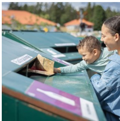
Hitta din närmaste återvinningsstation

Från och med 1 januari tog Uppsala Vatten över ansvaret för de obemannade återvinningsstationerna i Uppsala kommun. På Hitta återvinningen - Sopor.nu kan du hitta alla återvinningsstationer och anmäla om de behöver tömmas, städas eller snöröjas. För mer info, gå gärna in på Uppsala Vattens hemsida: uppsalavatten.se