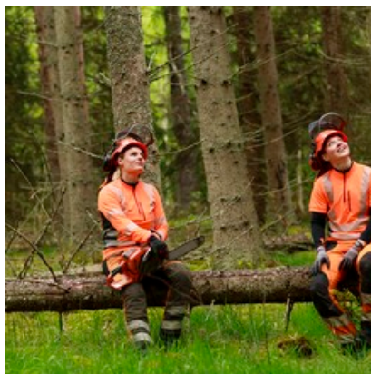
Nu sker en del avverkning och gallring av träd

Bygget av nya huvudgatan som binder samman Fullerö med Storvreta förväntas dra i gång under våren 2024. Inför detta kommer vi inom kort att göra en avverkning där själva gatan kommer att byggas och påbörja skogsvårdsarbete i skogen mellan Fullerö och Storvreta. Med skogsvård menas att man gallrar och låter skadade träd ge plats så att friska träd kan växa till sig bättre. Var gärna uppmärksam när du går i skogen under avverkningen och håll dig på avstånd när det sågas.