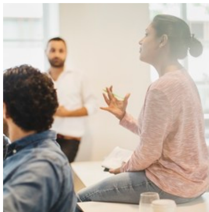
Bygderåd - ytterligare ett sätt att påverka

Din förening kan ansöka om att bli stadsdels- och bygderåd och få en roll som dialogpart till kommunen. Läs mer om detta på uppsala.se