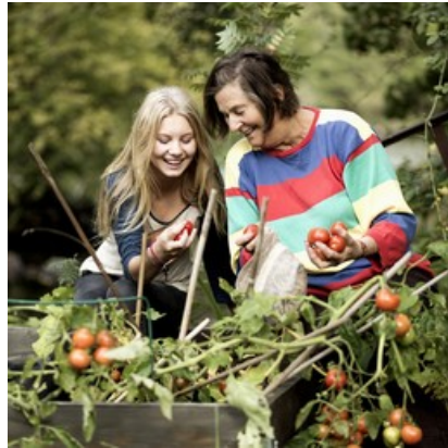
Årets landsbygdsaktör - du kan nominera

Vet du någon eldsjäl, förening, grupp och företag som under 2023 har bidragit till Uppsala kommuns utveckling av landsbygderna? Läs mer och nominera senast 15 mars, klicka på länken nedan. Årets landsbygdsaktör - Uppsala kommun