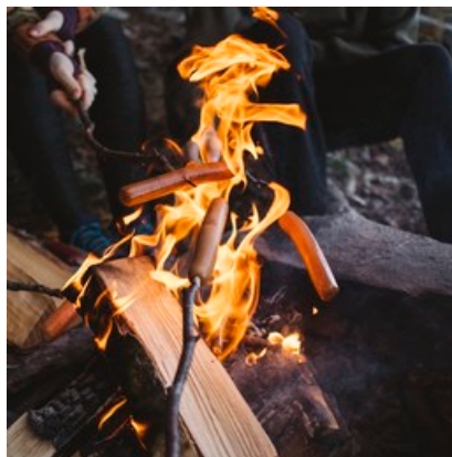
Åka skidor eller bara mysa vid brasan?

Välkommen till en friluftsdag i rörelsens tecken! Tisdag den 5:e mars klockan 10.00 – 13.00 är du som är 65+ varmt välkommen att delta vid en aktivitetsdag på Storvreta IK:s Skogsvallen. Du kan åka skidor (viss möjlighet att låna utrustning på plats), träna stågympa utomhus, gå tipsrunda och fika vid öppen eld. Eller bara ta en kopp kaffe och umgås. Vi bjuder på lättare förtäring så som varmkorv, kaffe och fika. Läs mer på Träffpunkt 65+ Storvreta