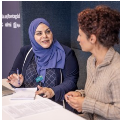
Fler tillfällen för utbildnings- och jobbcenter

Utbildning- och jobbcenter kommer att vara i Storvreta mer frekvent under våren, bland annat kommer det vara öppet hus den 10/4 och 24/4. Lokal är inte bestämd ännu, så mer info kommer publiceras här senare under våren: uppsala.se/storvreta Via utbildnings- och jobbcenter kan du få information om vuxenutbildning samt om jobb och praktik. Läs mer om det här: Utbildnings- och jobbcenter (uppsala.se) .