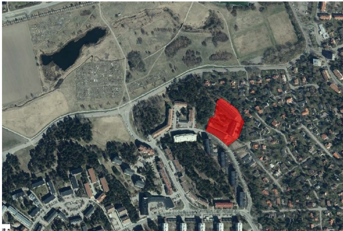
Fastigheten Eriksberg 4:1, markerad med en röd färg.

Fastigheten Eriksberg 4:1 ägs av Rikshem AB och är idag bebyggd med tre bostadshus om vardera tre våningar samt två garagelängor. Husen uppfördes 1959 och är formerade i en hästskoform runt en större gård. Fastigheten vetter mot Glimmervägen i söder och omges i övrigt av Rödbergsparken. Närområdet är bebyggt med villor och annan trevåningsbebyggelse. På andra sidan Glimmervägen ligger lamellhus i åtta våningar.