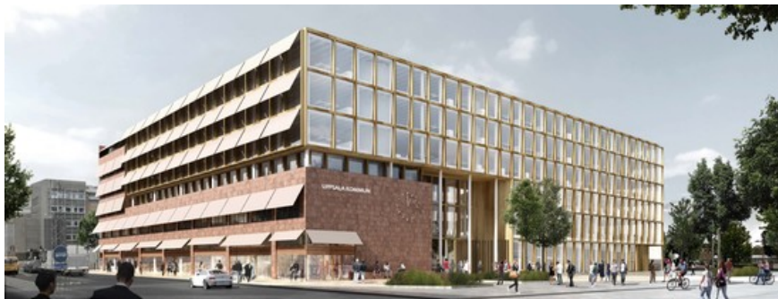
Illustration: Henning Larsen Architects

Nytt från Uppsala kommun Nyhetsbrev oktober 2018