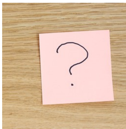
Bild på ett frågetecken. Du kanske också undrar något? Hör av dig till oss.

Läs frågor och svar eller ta reda på hur du kan ställa en ny fråga här.