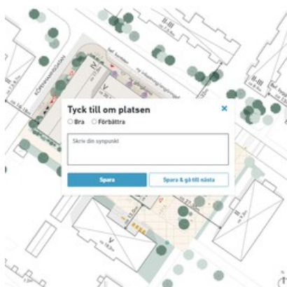
Bild på hur webbsidan ser ut där man kan tycka till. Passa på att gå in här du också.

Mer om hur du lämnar synpunkter i dialogkartan här.