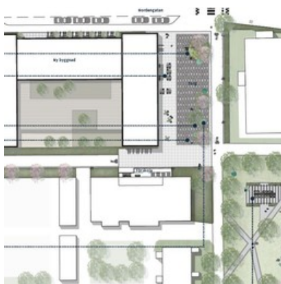
Del av illustration av det tänkta torget och parken i Hindsgavl. Det finns både gröna och lugna ytor att använda.

Kolla in skissen på torget och parken här.