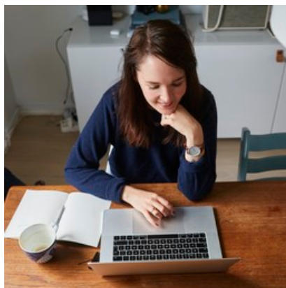
Bild på kvinna som sitter vid en dator. Nyhetsbrevet kommer till de som prenumererar på dessa och skickas när vi har ny information om arbetet med kvarteret Hindsgavl.

Här anmäler du dig till vårt nyhetsbrev.