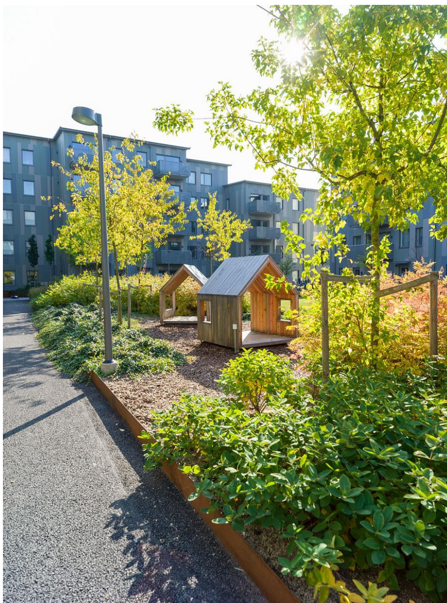
Östra Sala Backe. Åke Sundvall, kv Knäckeipilen. Landskapsarkitekter: Karavan.

Lagkrav: PBL 8 kap. 9 § andra stycket. Barnrättslagen.