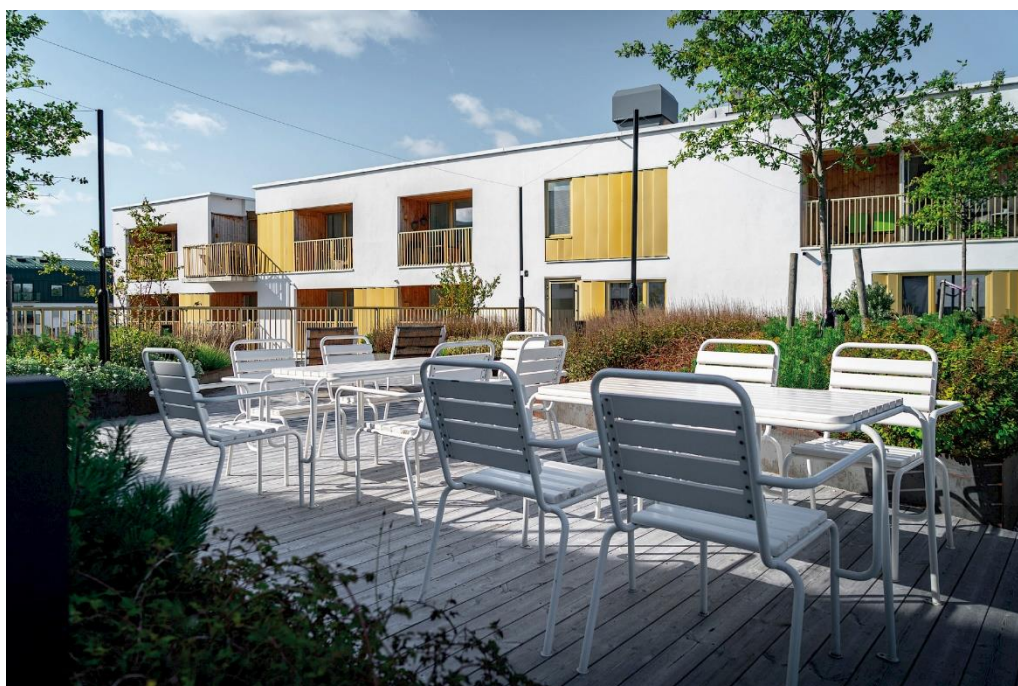
Rosendal etapp 2. Rosendalsfastigheter, projekt Grindstugan. Landskapsarkitekter: Karavan.

Lokala mål: Översiktsplanen - Plats för de goda livet. Riktlinjer för Arkitektur och gestaltungsfrågor KSN-2014-0630, Program för full delaktighet, Mål och budget: Fokusområde Trygghet.