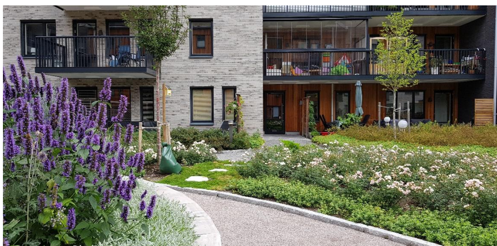
Rosendal, etapp 2. JM, projekt Rosalia.

Lokala mål: Översiktsplanen - Plats för de goda livet, Mål och budget: Fokusområde Trygghet.