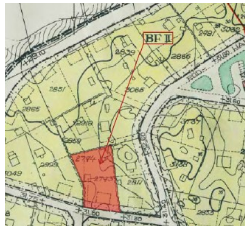
Utsnitt ur gällande detaljplan. Aktuella fastigheter markeras med röd yta.

Nuvarande fastighetsindelning regleras av Tomtindelning för del av kvarteret Rödhaken , 0380-15/SU54, fastställd 1967. Det är den tomtindelningen som nu upphävs för de aktuella fastigheterna.