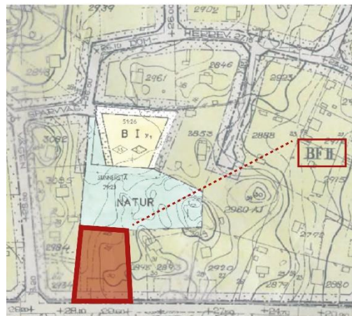
Utsnitt ur gällande detaljplan. Aktuella fastigheten markeras med röd yta.

Nuvarande fastighetsindelning regleras av Tomtindelning för kvarteret Meshatten , 0380-20/SU79, fastställd 1966.