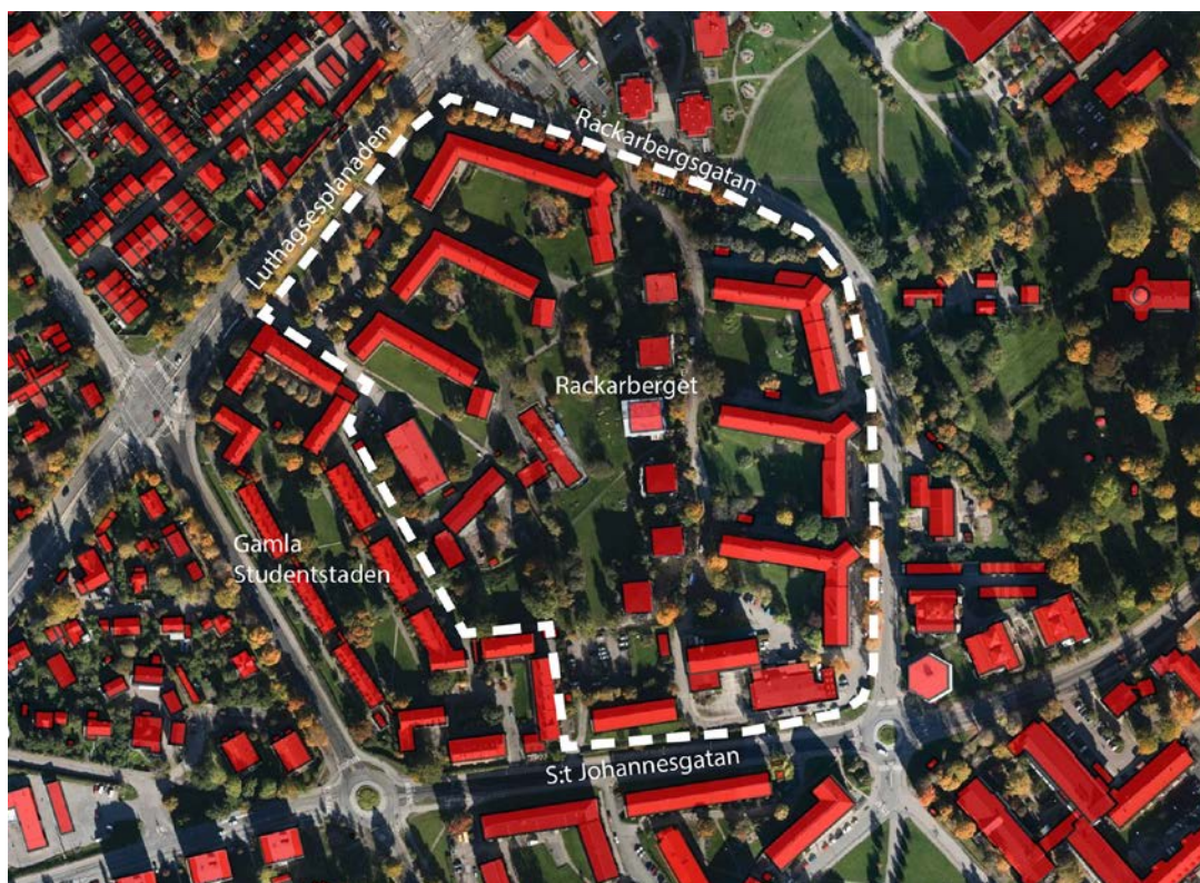
Planområdets ungefärliga avgränsning