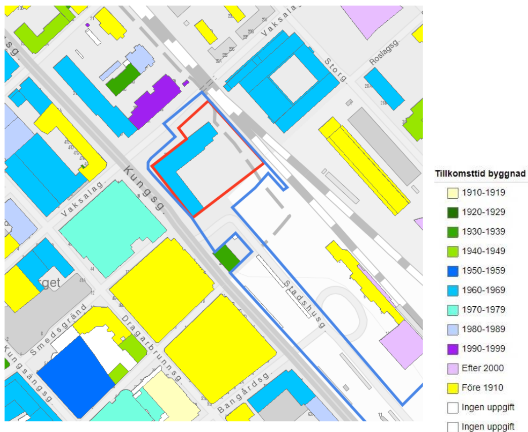
Tillkomsttid för byggnader i och kring planområdet. Planområdet markeras med blå linje. Det område som berörs av planändringen markeras med röd linje.

Bebyggelsen intill stadshuset har vuxit fram i etapper. Här finns byggnader från tiden kring det förra sekelskiftet såväl som från 1900-talets andra hälft. Gaturummet längs Vaksalagatan, och delvis Kungsgatan, kantas av butiker, restauranger och lokaler för annan kommersiell verksamhet.