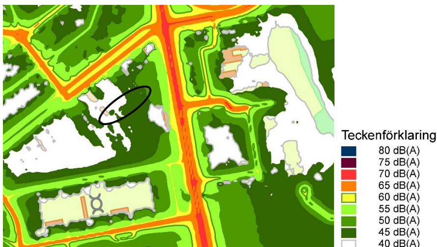
Bild. Utdrag ur bulleranalys för vägar, genomförd av Ramböll på uppdrag av Uppsala kommun 2011. L_{max} 2 m över mark. Ljudnivå i dB(A). Aktuellt område markerat med svart ellips.

Det aktuella planområdets läge, relativt långt ifrån det allmänna gatunätet, bidrar till låga bullernivåer i planområdet.