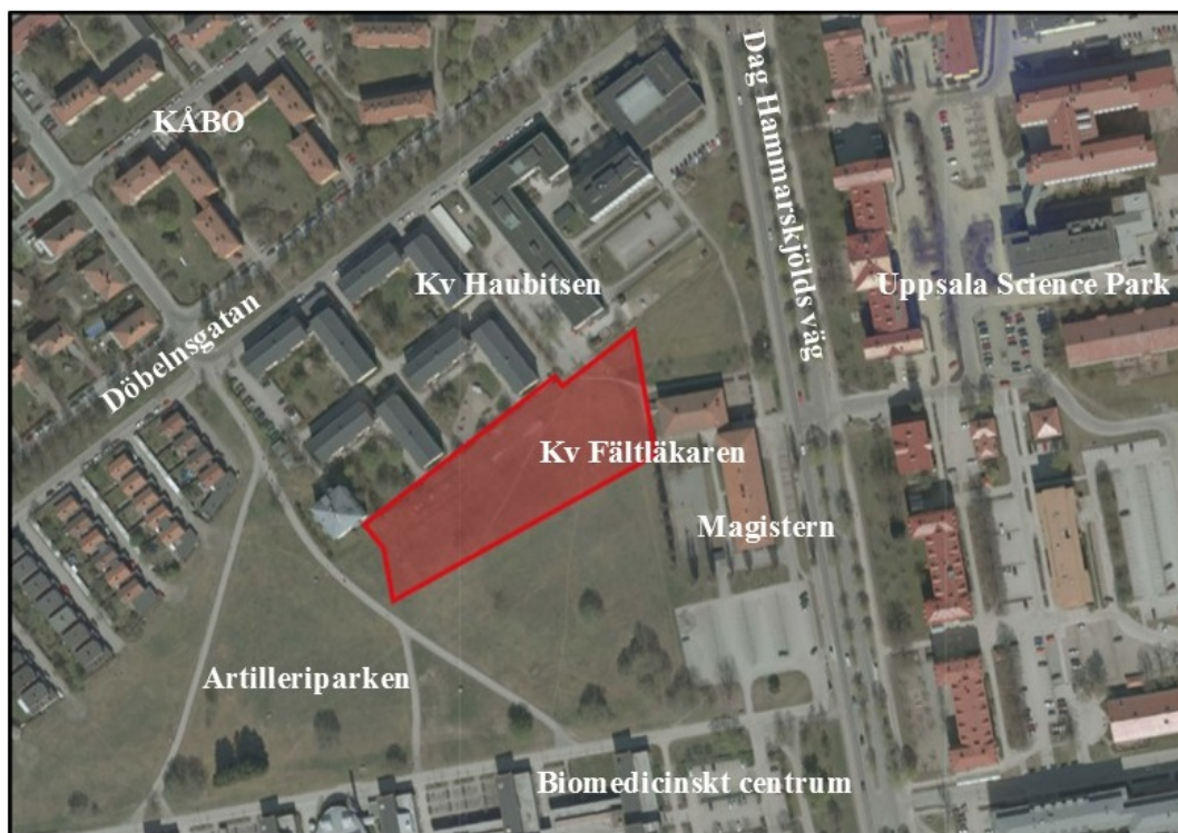
Bild 1: Planområdets lokalisering. Dag Hammarskjölds väg går i nord-sydlig riktning i högra delen av bilden.

En utfart reserverad för sopbilen vid hämtning av hushållsavfall föreslås genom kvarteret Haubitsen, där en del av gatan redan trafikeras av sopbil, detta för att undvika backrörelser.