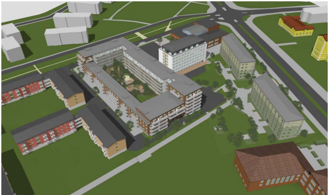
Perspektiv från pågående produktion av bebyggelse inom Kåbo 53:1. Det aktuella planområdet ligger i förgrunden. Bild: Vera arkitekter.

Den pågående byggnationen av bebyggelsen inom Kåbo 53:1 omfattar ett bostadskvarter i tre till sex våningar och en byggnad i fem våningar inrymmande studentbostäder mitt i fastigheten, samt ytterligare två byggnader i vardera fem våningar utmed Dag Hammarskjölds väg, för studenter/ungdomar.