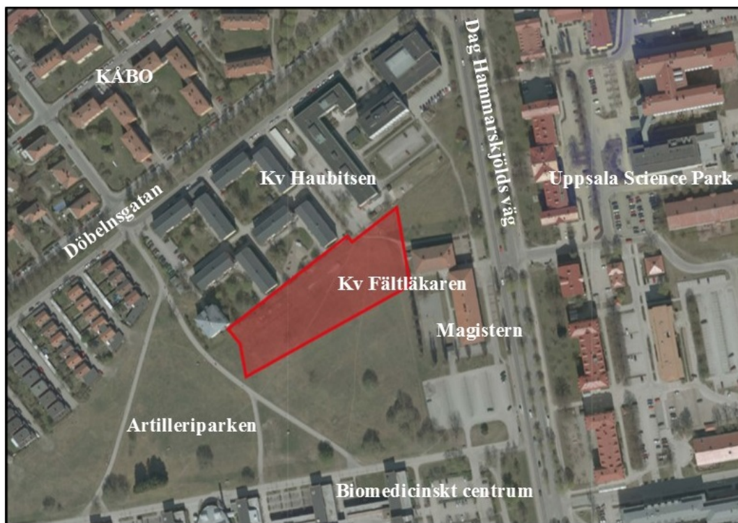
Bild 1: Planområdets lokalisering. Dag Hammarskjölds väg går i nord-sydlig riktning i högra delen av bilden.

En utfart reserverad för sopbilen vid hämtning av hushållsavfall föreslås genom kvarteret Haubitsen, där en del av gatan redan trafikeras av sopbil, detta för att undvika backrörelser.