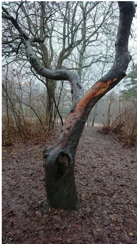
Äldre äppelträd (nummer 35) med hål och exponerad stamved.