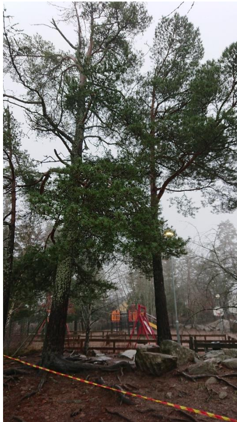
Two tallars (nummer 4). Senvuxna, ena med död topp.