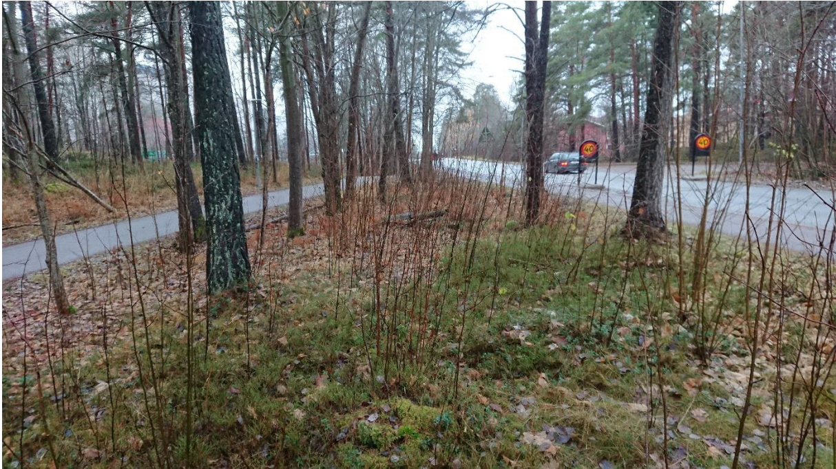
Figur 1. Skog mellan bilväg och cykel/gångväg, som utgör en del av tallskogen kring Flogsta höghus.