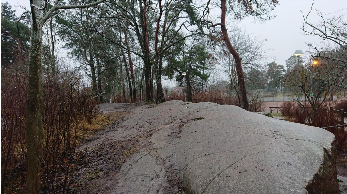
Figur 2. Klipphäll strax öster om skolbyggnaden med äldre tallar i bakgrunden.