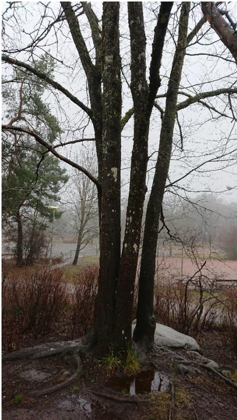
Skogsalm (nummer 24) med fyra stammar. Troligen almsjuka.