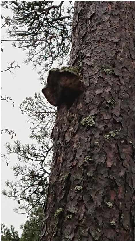
Tallticka på tall (nummer 27).