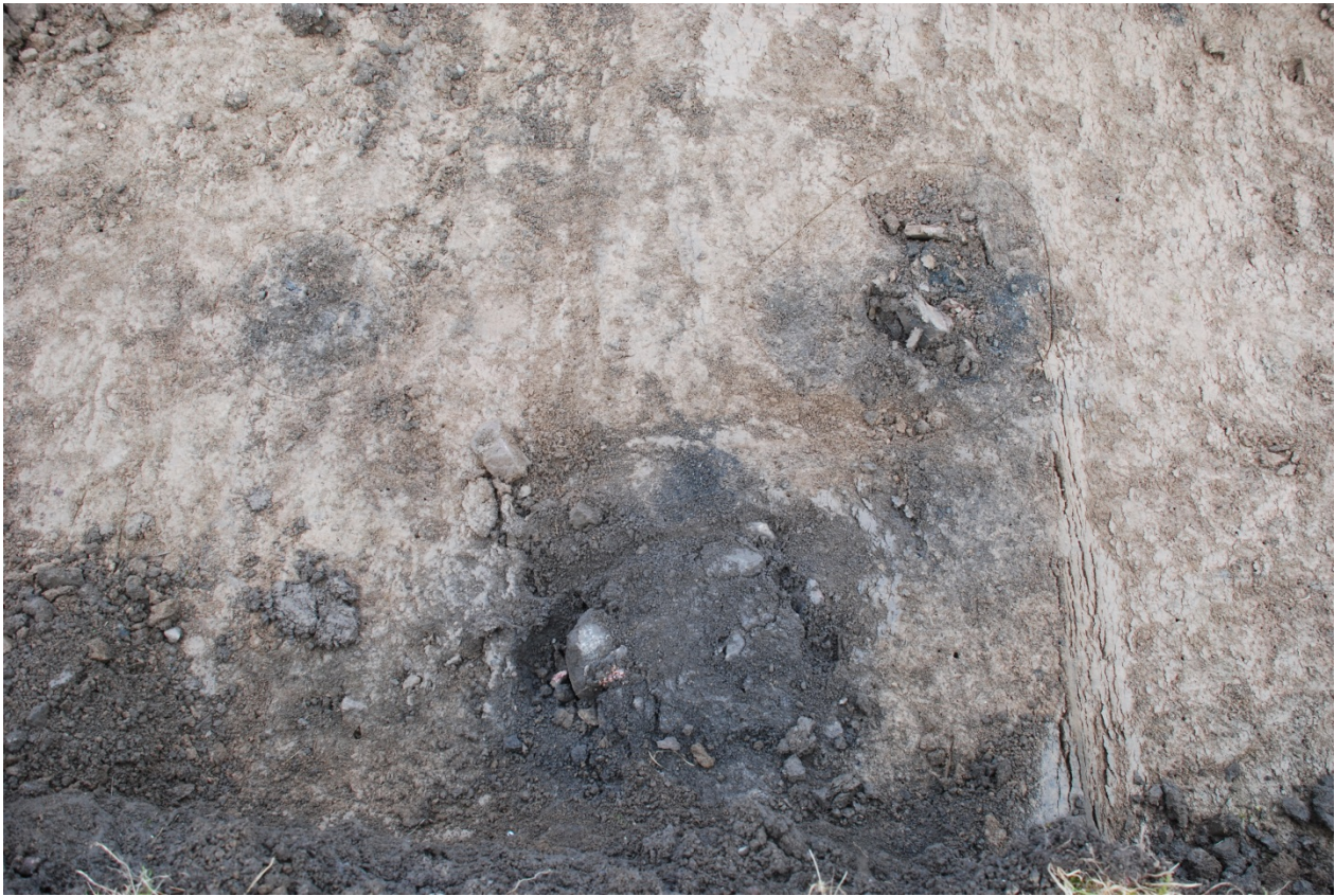
Figur 5. Lodfoto över Stolphålen A139, 145 och 150. Stolprader i området indikerar att det sannolikt rör sig om hus eller hägnader.