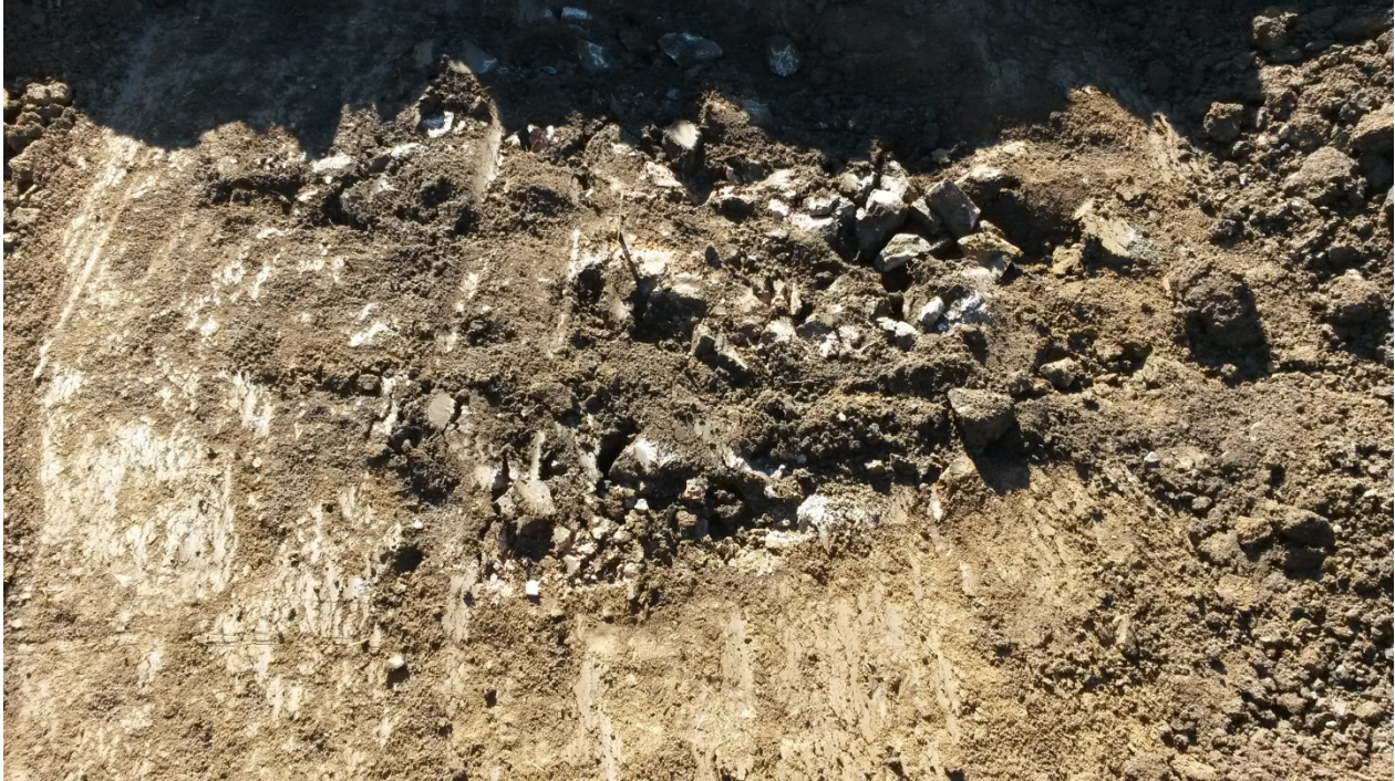
Figur 4. Lodfoto över kokgropen A245 som var en av de anläggningar som framkom i norra delen av utredningsområdet.