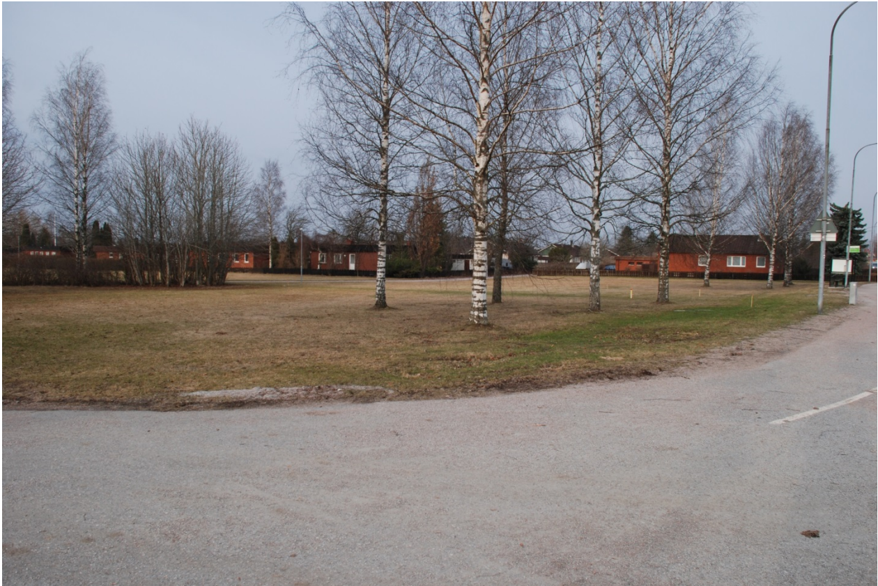
Figur 2. Översikt över norra delen av undersökningsområdet där huvuddelen av anläggningarna framkom. Foto, från nordöst: Niclas Björck.