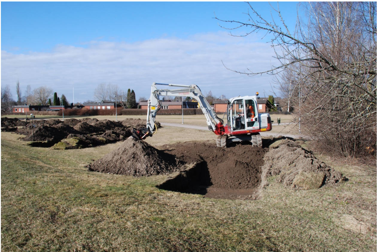
Figur 3. Arbetsbild från nordöst, schaktning i södra delen av undersökningsområdet.