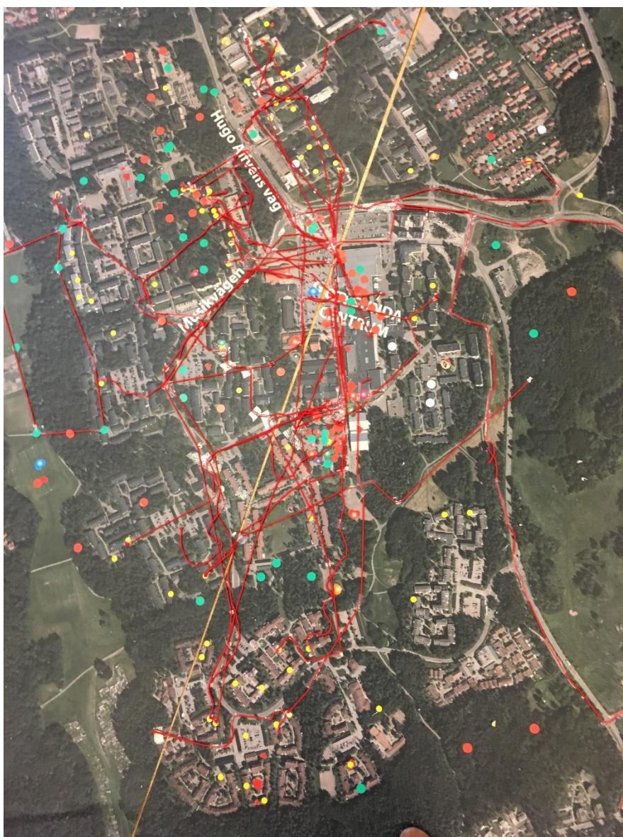
Uppre: Foto på kartmattan där barnen visade var de bor, var de leker och hur de tar sig till Gottsunda centrum. Med gula prickar visar de var de bor.

De flesta barn som kom bor i hyresrättsområden i Gottsunda/Valsätra. Många bor på Bandstolsvägen, Stenhammars, Blomdahl, Petersonbergers, Solist och Dirigent. Några få bor i bostads- och äganderättsområden såsom Cellisten, Valsätra och Bäcklösa. Genom barn sommarkul nådde kommunen barn från områden som har varit mycket lågt delaktiga i samrådet för planprogrammet i maj-juni 2018.