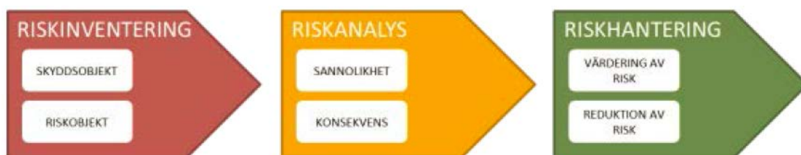
Bild 1. Riskhanteringsprocessen som har använts vid riskanalysen av Ulleråker och i följande riskhantering följer i huvudsak Räddningsverkets handbok för riskanalys (2003). Även Livsmedelsverkets Risk- och sårbarhetsanalys för dricksvattenförsörjning (2007) har använts i tillämpliga delar.

Skyddsåtgärder (inklusive val av markanvändning) är framtagna så att målen nås i fokusområdet hållbar vattenmiljö.