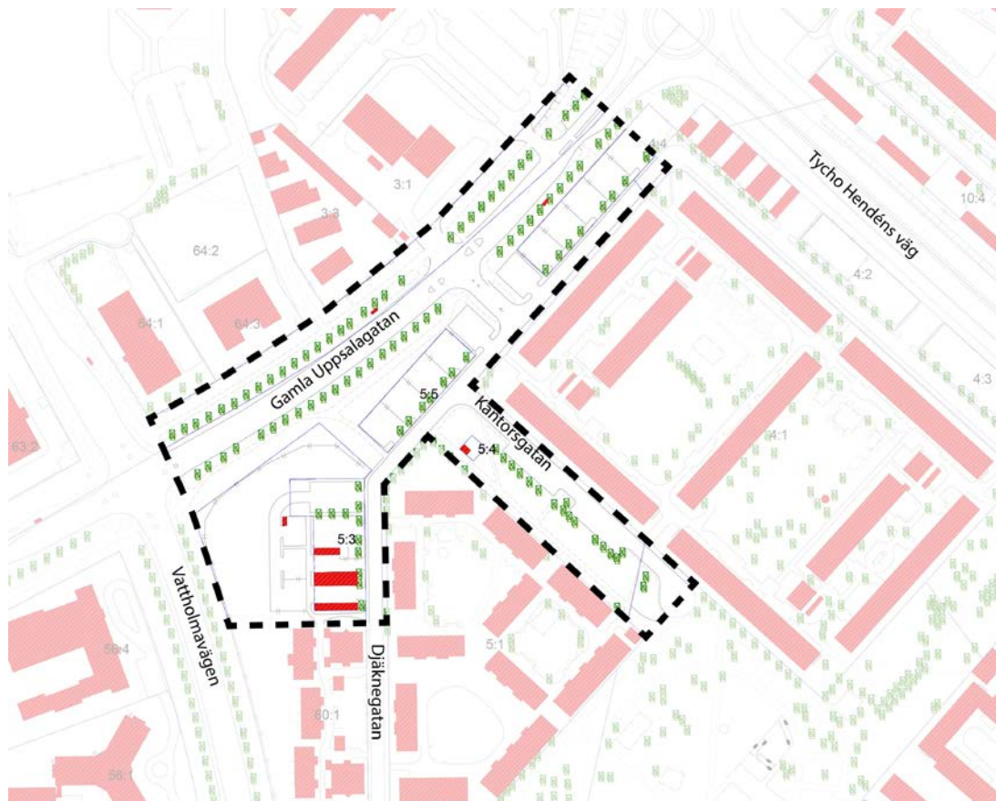
Karta som visar det ungefärliga planområdet markerat med streckad linje.