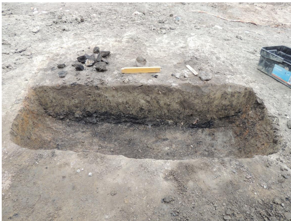
Figur 3. Ett tvärsnitt genom en välbevarad lågtemperaturugn i områdets östra delar.