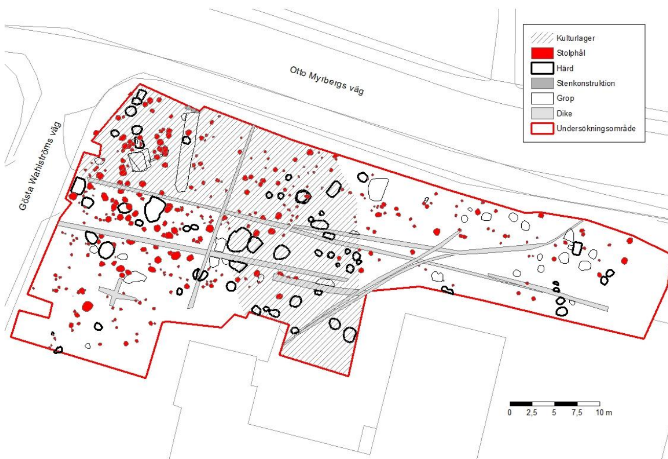
Figur 2. Plan över undersökningsområdet med framkomna objekt markerade. Notera koncentrationen av större stolphål i de nordvästliga delarna.