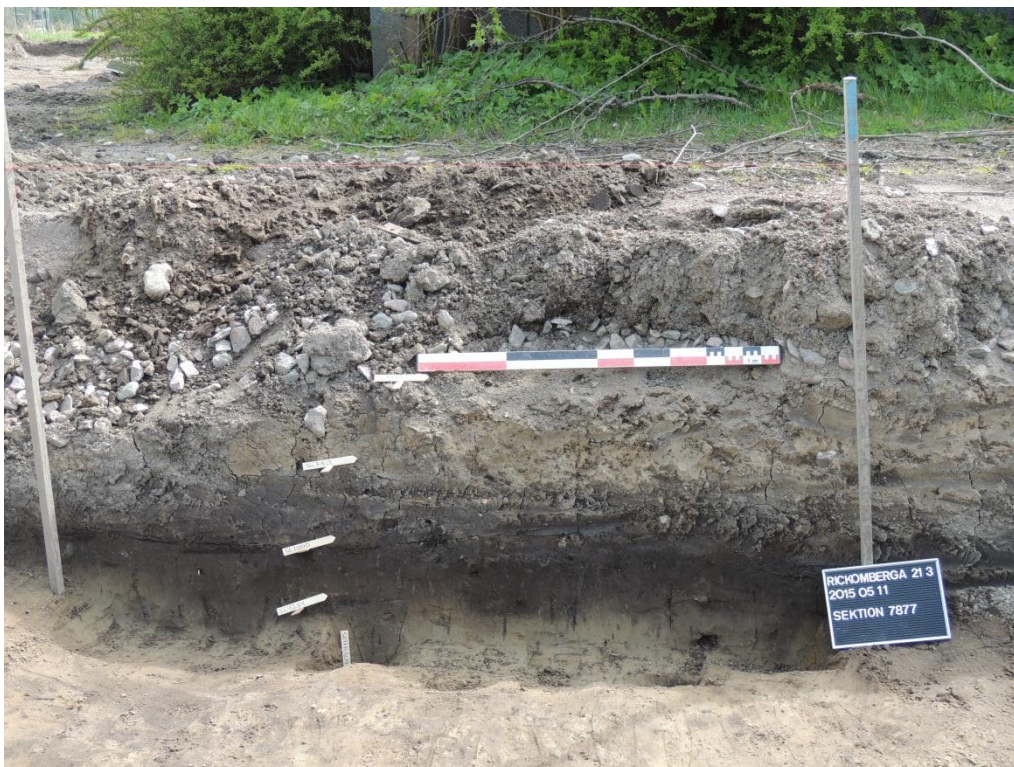
Figur 5. Tvärsnitt av schaktkant i områdets södra delar med odlingslagret som täckte de flesta anläggningar tydligt i botten.