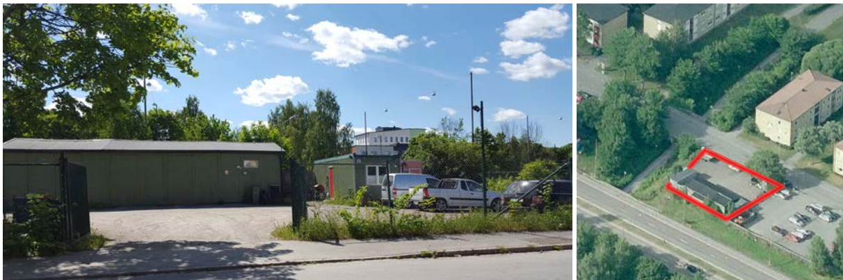
Bilderna visar hur området ser ut idag med en byggnad och grusade parkerings- och uppställningsytor.