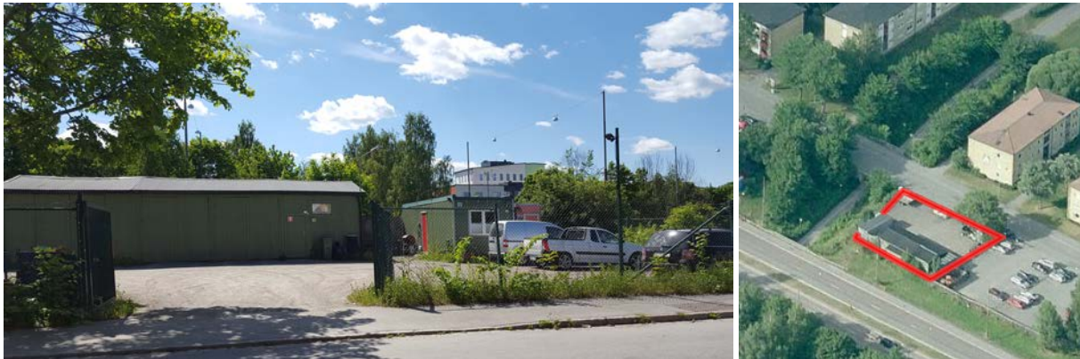
Bilderna visar hur området ser ut idag med en byggnad och grusade parkerings- och uppställningsytor.