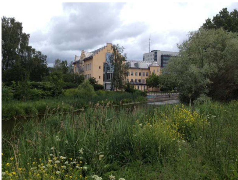
Å-rummet och kv. Heimdal sett från aktuellt planområde. (Tengbom)

Aktuellt planområde är idag utformat så att inga direkta kopplingar finns från Götgatan till å-rummet. Miljön kring skolan är idag behov av upprustning. Engång- och cykelväg går i det allmänna parkstråket längs Fyrisån och följer sedan järnvägen norrut mot Ringgatan. Parkstråket längs Fyrisån i detta avsnitt har naturmarkskaraktär. En provisorisk passage under järnvägen, längs med ån, har anordnats för att öka tillgängligheten mellan aktuellt planområde och ny bebyggelse i det angränsande kvarteret Fyrisvallen.