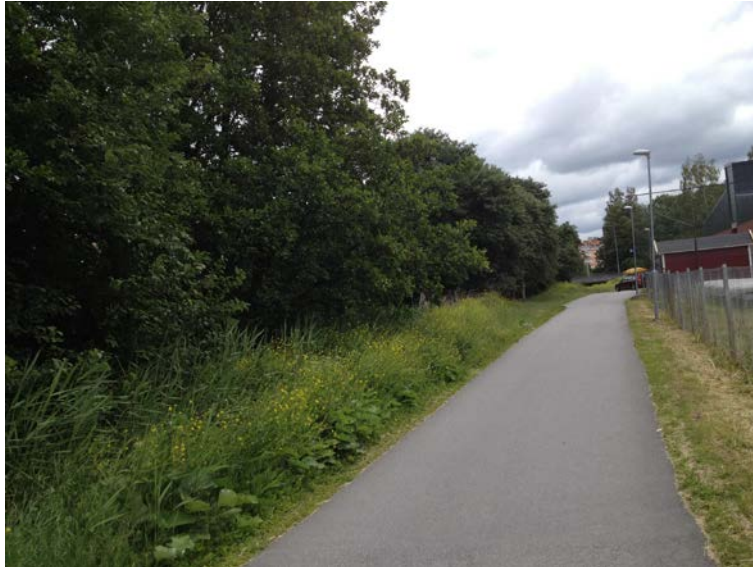
Gång och cykelvägen, ån till vänster och idrottsplatsen till höger inramad av Gunnebo stängsel. (Tengbom)