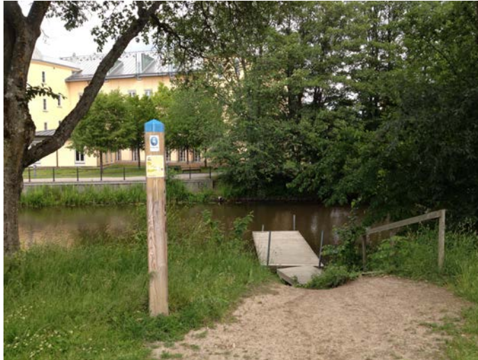
Brygga som utgör dagens vattenkontakt längs aktuell område. (Tengbom)