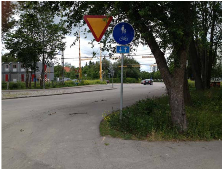
Läge för ny föreslagen planskild korsning vid Ringgatan. (Tengbom)

Det finns planer på en planskild korsning mellan järnvägen och Ringgatan. För att kunna skapa en planskild korsning krävs vissa anpassningar i gatunätet. I samband med planarbetet för kv. Seminariet norr om järnvägen har trafiktekniska studier gjorts för sänkningen av Ringgatan, vilka är relevanta även söder om järnvägen. Götgatan behöver stängas för trafik vid en ombyggnad, eftersom anslutningen till Ringgatan då skärs av. En vändplan som är tillräckligt stor för underhållsfordon behöver därför skapas, och utanför den behövs en ca 50 meter lång ramp för gång- och cykeltrafik. Dessa anpassningar kan ske på befintlig gatumark och påverkas inte av planförslaget.