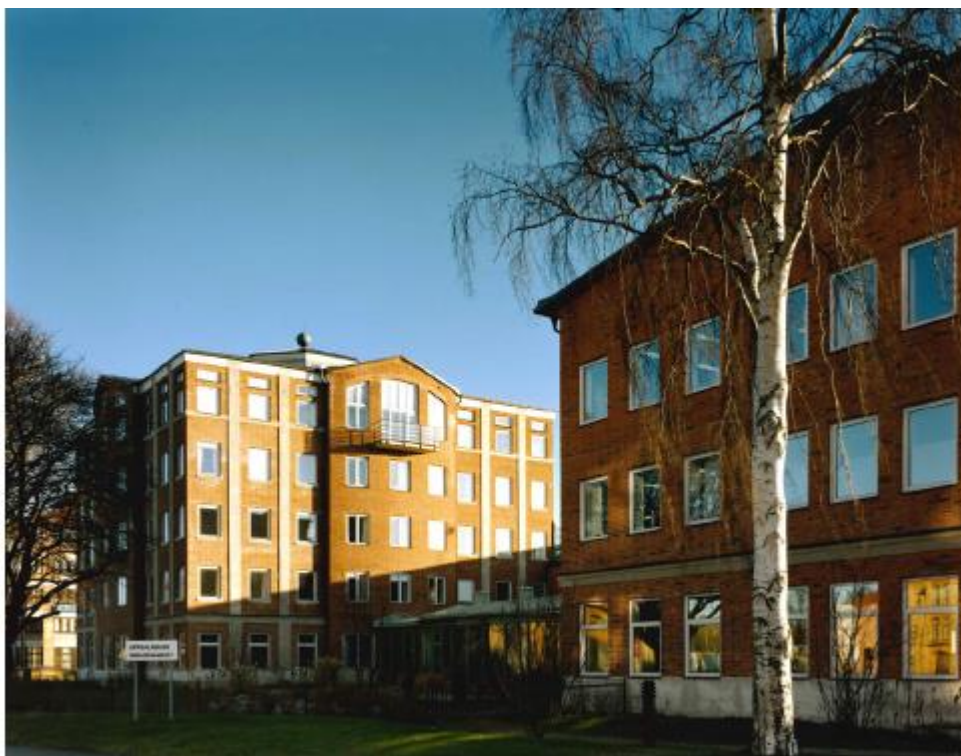
Navet, sett från Strandbodgatan. Foto: Åke E:son Lindman 1991.

I Norra Hovstallängens nordöstra del ligger idag Uppsala buss AB:s huvudkontor, kallat Navet. Det innehåller huvudkontoret för Uppsala buss AB, och utgör en grupp byggnadsvolymer, som består av en kontorsbyggnad, en verkstadsbyggnad och personalbyggnad. Navet är inte q-märkt. Byggnaderna är alla i tegel med inslag av betong. Huvudbyggnaden är i klassicistisk stil. I en kulturhistorisk värdering som gjordes av White i juni 2020 beskrivs att Navet berättar om Uppsalas utveckling och transportsystemets betydelse för staden. Navet beskrivs som ett tydligt exempel på den kvalitet i material, detaljering och gestaltning som är vanlig vid offentligt byggande. Den höga ambitionsnivån visar på en stolthet för verksamheten och dess betydelse för staden, och byggnadskomplexet är ett exempel på arkitekturen och planeringen under 1980- och 1990-talen. I den kulturhistoriska värderingen beskrivs Navet som en ovanligt välbevarad postmodern byggnad. Ett beslut har tagits att huvudkontorsbyggnaden Navet ska finnas kvar, vilket ska säkras i detaljplanen. Planen ska dock ge möjlighet att ny bebyggelse kan byggas ihop med Navet.