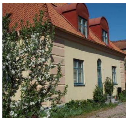
Foto av en q-märkt byggnad inom kv. Hovstallängen (nr 4 i kartan ovan).