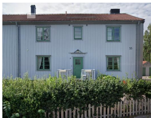
Foto av en q-märkt byggnad inom kv. Hovstallängen (nr 2 i kartan ovan).