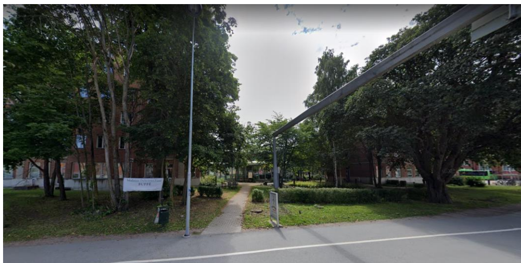
Parkmiljön vid Navet längs Stranbododgatan.