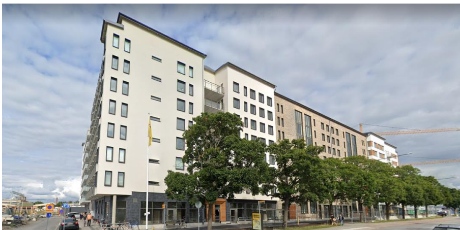
Ny bostadsbebyggelse öster om Kungsgatan.

Området öster om Kungsgatan, kvarteren Kryddblandaren och Krossen, håller på att bebyggas med bostäder, varav några byggnader är färdigställda. Byggnaderna karakteriseras av fasader i puts eller tegel med en höjd av åtta våningar. Byggnaderna har en fasad mot Kungsgatan som varierar i uttryck genom till exempel indrag, färg och fasadmateriell. Den befintliga raden av träd står kvar mellan byggnaderna och gatan.