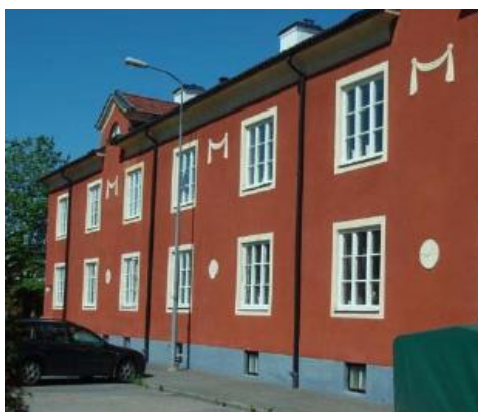
Foto av en q-märkt byggnad inom kv. Hovstallängen (nr 1 i kartan ovan).

I Hovstallängens sydvästra del uppfördes efter sekelskiftet ett antal mindre arbetarbostäder i anslutning till Uppsala Ångkvarn. Dessa är rivna, men ersattes på 1920-talet av ett mindre bostadsområde med omsorgsfullt utformade byggnader ritade av bland annat Theodor Kjellgren och Gunnar Leche. De delar av detta område som finns bevarade fick 1989 skyddsbestämmelser som innebär att de inte får rivs. Det finns sex q-märkta byggnader inom området, varav de flesta är i två våningar med fasader i stående träpanel eller puts och med sadeltak i tegel. Området kring det q-märkta bostadsområdet är betecknat som särskilt värdefull bebyggelsemiljö i en inventering av Carl Erik Bergold och P O Sporrang 1985. Bebyggelsen i den södra tredjedel av detta område har emellertid rivits.