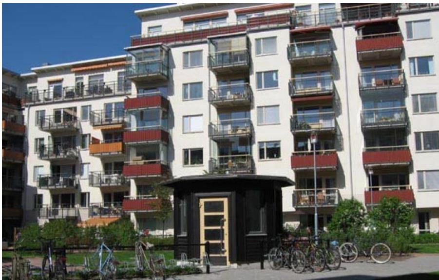
Exempel på byggnad från 2000-talet i Kungsängen.