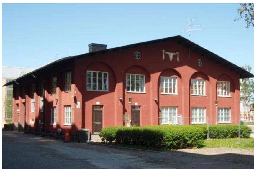
Bild på den gamla köttbesiktningsbyrån.

”Köttinspektionen” används idag som en konstnärsdriven mötesplats där man producerar konst, teater och dans. Planen ska säkra att byggnaden inte rivs, och att byggnaden kan anpassas och göras tillgänglig. Till exempel kan det vara möjligt att öppna upp de igenmurade valven och del av fasaden.