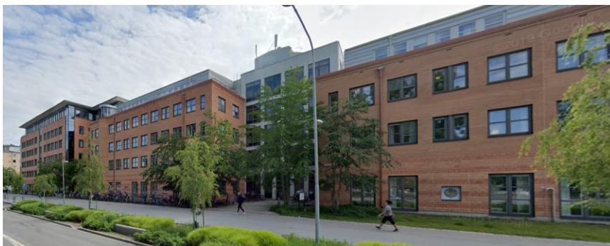
Byggnader innehållande verksamheter i kv. Munin, sedda från Strandbodgatan.

I kvarteret Munin ligger bebyggelse innehållande olika kontorsverksamheter. Byggnaderna är från cirka år 2000 och det finns mer byggrätt inom kvarteret vilket möjliggör nybyggnation. De befintliga byggnaderna har röda tegelfasader och är i fyra till sex våningar, där den högsta våningen i stora delar är indragen. På den outnyttjade byggrätten i hörnet Strandbodgatan-Muningatan finns möjlighet att bygga sju våningar med en totalhöjd på +28 meter över nollplanet.