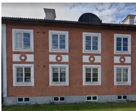
Foto av en q-märkt byggnad inom kv. Hovstallängen (nr 3 i kartan ovan).