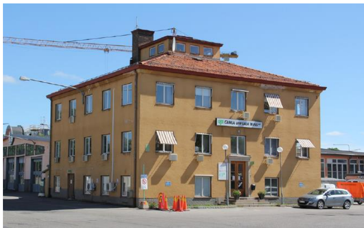
Busstornet, är ritat av Gunnar Leche.

Busstornet är en byggnad ritad av Gunnar Leche från 1947 (nr 6 i kartan ovan). I gällande detaljplan omfattas byggnaden av bestämmelser som anger att ändringar inte får göras som förvanskar dess karaktär eller anpassning till omgivningen. Beslut har tagits att busstornet ska bevaras, vilket säkras i detaljplanen. Planen ska dock ge möjlighet till viss utbyggnad för att kunna anpassa och tillgängliggöra byggnaden.