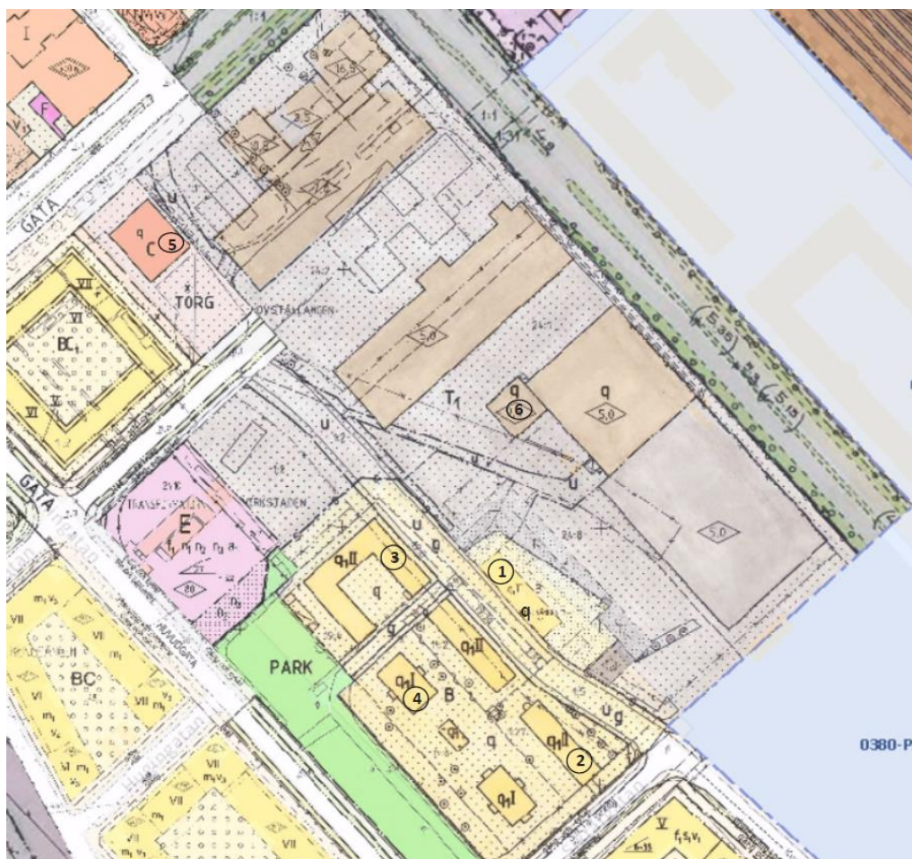
Karta som visar inskannad planmosaik inom norra Kungsängen, där man bland annat ser läget för q-märkta byggnader.

Bebyggelsen inom Kungsängen utgörs sedan 1900-talets början av i första hand små- och storskaliga industribyggnader i tegel och puts. I området finns en låg samlad bebyggelse av arbetarbostäder från 1900-talets början. Under årens lopp har Kungsängens bebyggelse kompletterats med verkstadsbyggnader, försäljningshallar och silobyggnader. Senaste åren har det även tillkommit kontorsbyggnader och bostadskvarter. Kungsängsområdet innehåller inga byggnadsminnen, dock finns ett antal byggnader med skyddsbestämmelser i form av q-märkning, vilka beskrivs nedan. Detta följs av beskrivningar av andra närliggande byggnader.