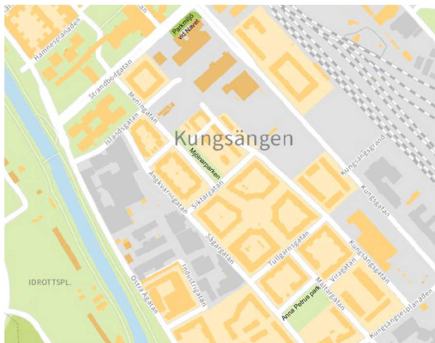
Karta som visar befintliga parkmiljöer i Kungsängen: parkerna ”Mjölnerparken och ”Anna Petrus park” samt parkmiljön vid Navet.

Befintliga träd i området kommer att behöva inventeras och värderas.