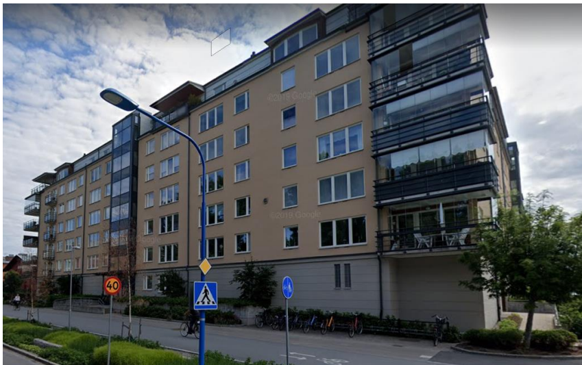
Bostadshus i hörnet Strandbodgatan-Muningatan.

En bostadsrättsförening bestående av ett kringbyggt kvarter med en innergård ligger i hörnet av Strandbodgatan och Muningatan. Byggnaden byggdes cirka 2004 och är i sex våningar samt en indragen sjunde våning. Byggnaden är i gul puts med en grå betongsockel.