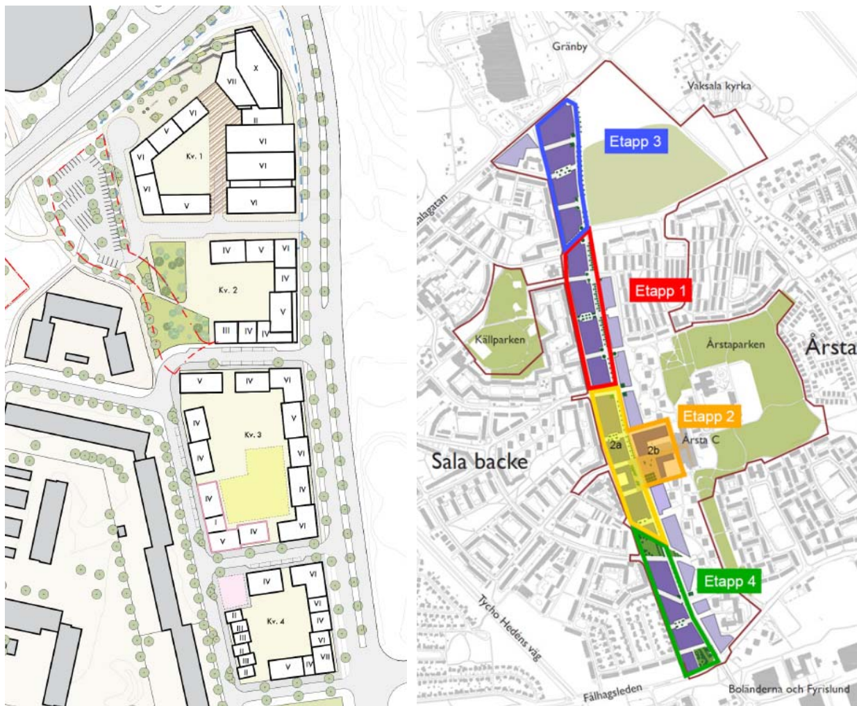
Bild till vänster visar en tidig skiss på hur området kan komma att utformas. Bild till höger visar hur planområdet förhåller sig till övriga etapper i Östra Sala backe.

Östra Sala backe rymmer totalt ca 2 000 bostäder väster om Fyrislundsgatan. På den östra sidan är marken i privat ägo, men kan uppskattningsvis inrymma ytterligare ca 500 bostäder. Årsta centrum utvecklas med handel, olika servicefunktioner, kultur, idrott, kontor och bostäder, och utgör områdets naturliga mötesplats. Tillkommande behov av förskolor, skolor och särskilda boendeformer kan tillgodoses inom programområdet men även genom att finna lämpliga platser inom Årsta och Sala backe. Bebyggelsen ges en egen karaktär och ett spännande uttryck. Strukturen ska bygga på variation enligt principen högt - lågt - tätt.