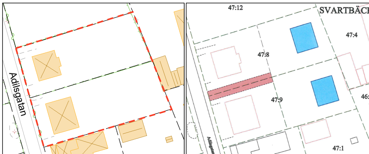
Vä: Fastigheterna i sin nuvarande utformning.

Ändringen får till följd att två nya bostadsfastigheter kan bildas öster om de befintliga. Dessa kan bebyggas med var sitt bostadshus i enlighet med detaljplanens bestämmelser. Kommande fastighetsgränser och bebyggelse hanteras i samband med lantmäteriförrättning respektive bygglovprövning.