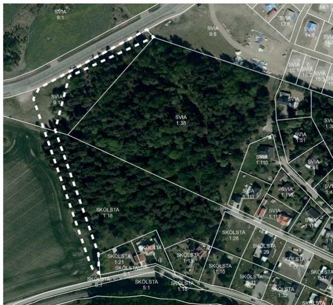
Området utgör brynzonen till ett mindre skogsområde, beläget vid infarten till Skölsta.

Detaljplanen är under genomförande. Genomförandet innebär bland annat inlösen av privat mark som planlagts som allmän plats. Det rör sig till exempel om mark som ska vara gata, park eller natur. Exploateringsavtalet med områdets byggherre JM AB säger att företaget ska köpa in all mark som ska bli allmän plats och överlämna den till Uppsala kommun utan ersättning.