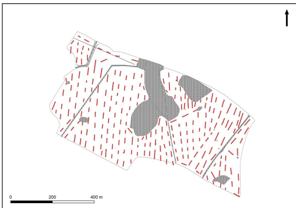
Figur 2. Undersökningsområdet med schakt i rött och åkerholmar, vägar och ledningar i grått.

I samband med fältarbetet drogs sammanlagt 242 schakt med en total yta på 13829 kvm vilket motsvarar ca 3,5 procent av ytan (se fig. 2). Merparten av schakten har lagts ut i nordsydlig riktning och har en bredd på ca 2-2,50 meter. Både riktning och bredd bestämdes för att maximera möjligheten att påträffa bock-par från eventuella stolphus liggande i öst-västlig riktning.