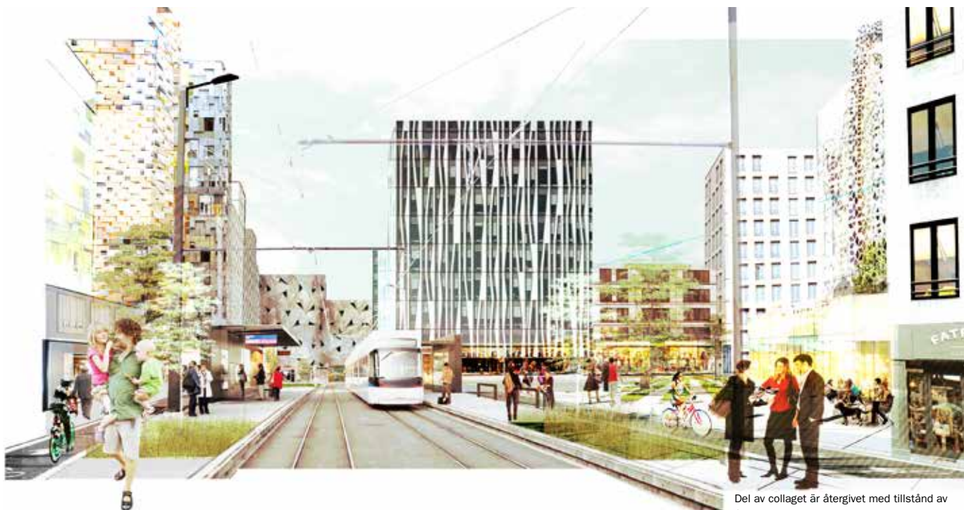
Del av collage är återgivet med tillstånd av Schmidt Hammer Lassen Architects